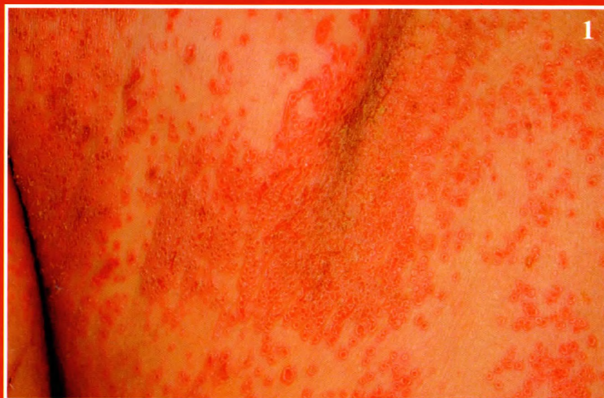
1. ábra: Testszerte, kiterjedten, monomorf, centrálisan behúzódott vesiculák, néhol összefolyó eróziók