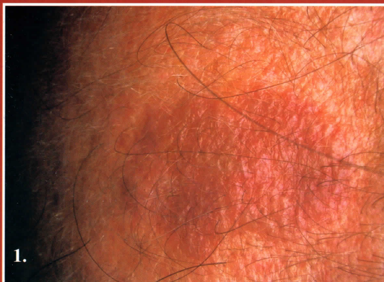
1. ábra: A fejtetőn barnásvörös, lapos plakk