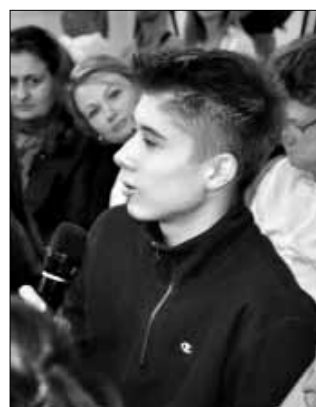
A diákok az előadáshoz kapcsolódó kérdéseikre is választ kaptak

ményekről is sok információt kaptunk. Az üvegházhatású gázok a légkörbe kerülve a melegházakhoz hasonlóan viselkednek: elnyelik a Föld felszínéről visszaverődő napfényt, mintegy csapdába ejtik, és nem engedik, hogy távozzon az űrbe. Az így létrejövő üvegházhatás felelős a Földön tapasztalható egyenletesen meleg hőmérsékletért, ami lehetővé teszi, hogy a bolygón élet alakuljon ki. Sok üvegházhatású gáz természetesen is megtalálható a légkörben, ugyanakkor az emberi tevékenység jelentősen hozzáad ehhez, fokozza az üvegházhatást és hozzájárul a globális felmelegedéshez.