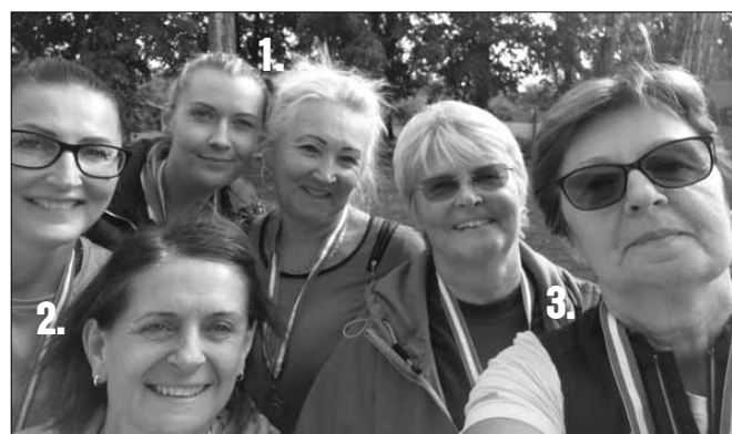
A helyezettek „szelfije”