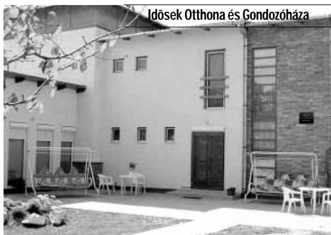
Idősek Otthona és Gondozóháza

A Gyulai u. 8. szám alatti Idősek Otthona és Gondozóháza akadálymentesített, parkosított, kellemes környezetben, családi légkörben, emelt szintű 2 ágyas, fürdőszobás szobákkal várja az idősek jelentkezését. Az otthon komplex, személyre szóló teljes körű ellátás, aktív pihenés keretében biztosítja lakói számára a kiegyensúlyozott életet.