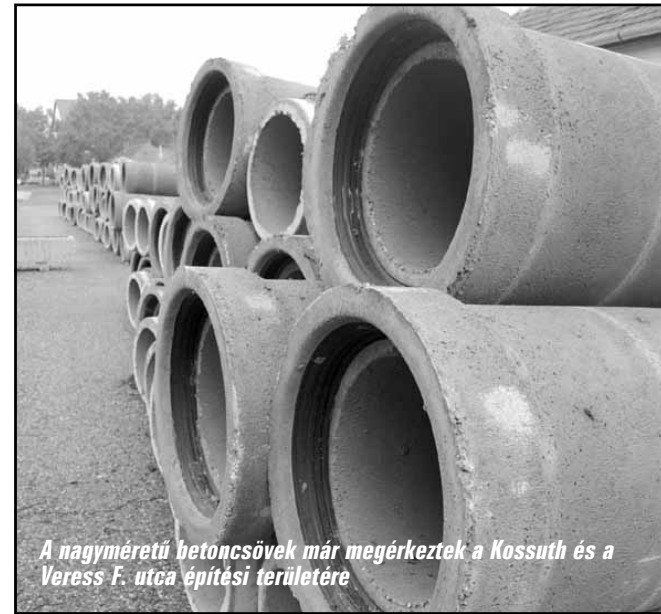
A nagyméretű betoncsövek már megérkeztek a Kossuth és a Veress F. utca építési területére