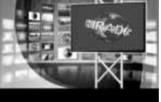
Friss közéleti hírek (ism)