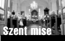
Közvetítés a katolikus templomból