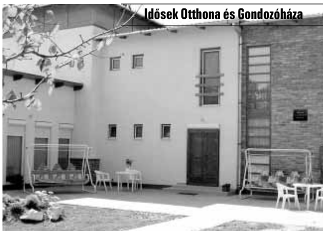
Idősek Otthona és Gondozóháza

A Gyulai u. 8. szám alatti Idősek Otthona és Gondozóháza akadálymentesített, parkosított, kellemes környezetben, családias légkörben, emelt szintű 2 ágyas, fürdőszobás szobákkal várja az idősek jelentkezését. Az otthon komplex, személyre szóló teljes körű ellátás, aktív pihenés keretében biztosítja lakói számára a kiegyensúlyozott életet.