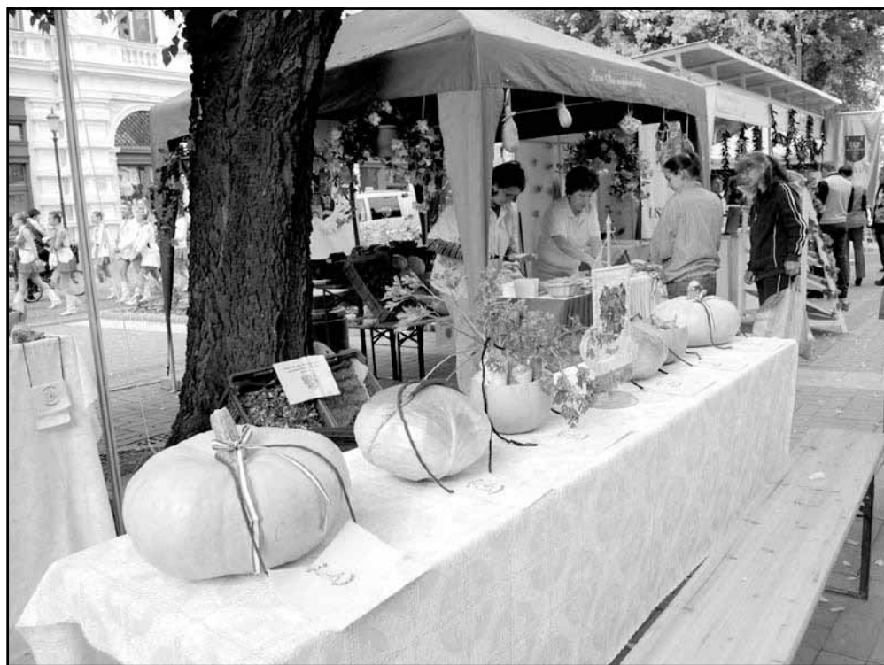
Sarkad standja a békéscsabai kiállításon, elötérben a szántóföldi zöldségtermesztés „gyöngyszemei”

A közmunkaprogramok fontosságát érzékelve, illetve a jövő esztendőre való felkészülés elősegítése céljából a Békés Megyei Kormányhivatal Munkaügyi Központja nagyszabású kiállítást rendezett 2013. szeptember 26-án Békéscsabán. Az új békéscsabai belvárost elfoglaló expón a megye valamennyi települése bemutatja közmunkaprogramját, mely kiállítás legfontosabb üzenete az volt, hogy a közmunkaprogram is lehet értékteremtő, a közmunkások is képesek lehetnek értékteremtésre, s a „ Start Munka Mintaprogram ” már több közönséges várossepregetésnél és szemétszedésnél. A bemutatkozó települési programok, a kiállított termékek,