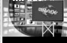
Friss közéleti hírek