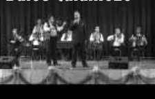
Közvetítés felvételről (I. rész)