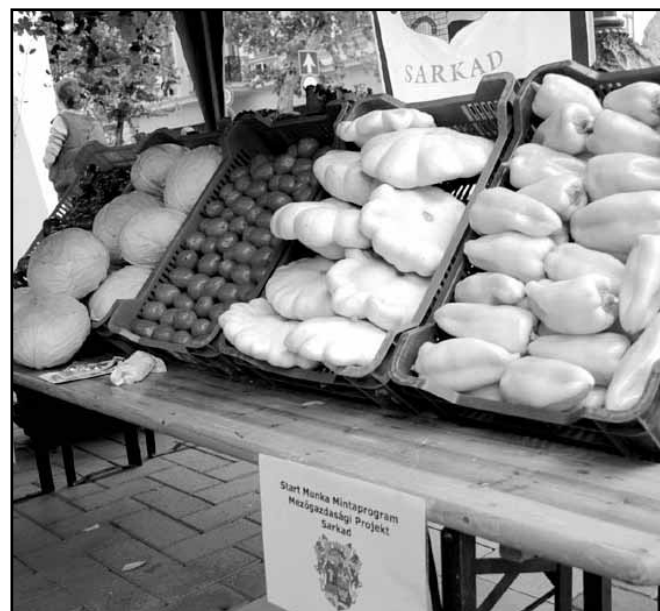
Az idén már jó minőségű zöldség feléket termeltek nagy mennyiségben (paprika, paradicsom, káposzta- és tökfélék)