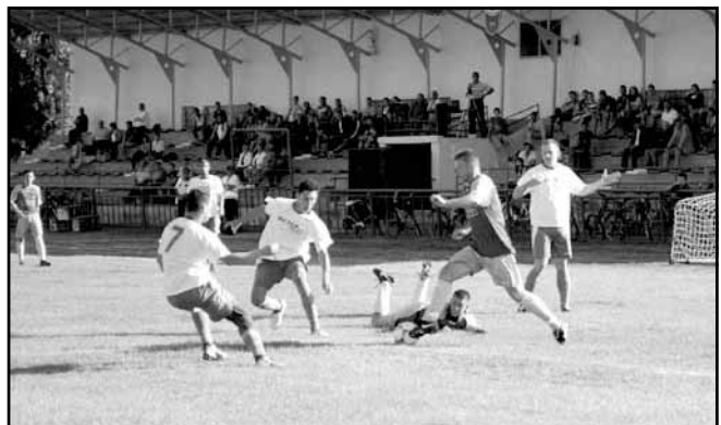
A 27. forduló eredménye: Sarkadi Kinizsi LE – Tótkomlói TC 1:1 (fehér felsőben a sarkadi csapat)

28. forduló 2013. május 25. (szombat) 17.00 óra