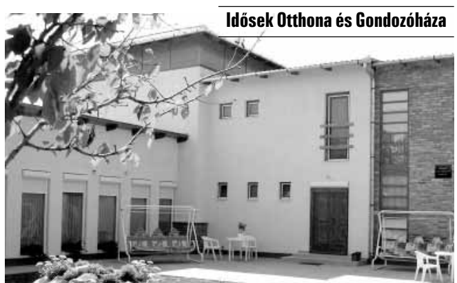
Idősek Otthona és Gondozóháza

A Gyulai u. 8. szám alatti Idősek Otthona és Gondozóháza akadálymentesített, parkosított, kellemes környezetben, családi légkörben, emelt szintű 2 ágyas, fürdőszobás szobákkal várja az idősek jelentkezését. Az otthon komplex, személyre szóló teljes körű ellátás, aktív pihenés keretében biztosítja lakói számára a kiegyensúlyozott életet.