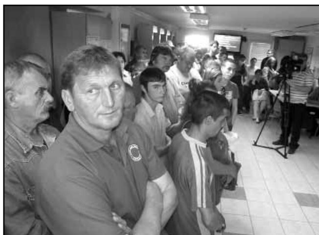
A sarkadi kirendeltségre meghívott álláskeresők egy csoportja