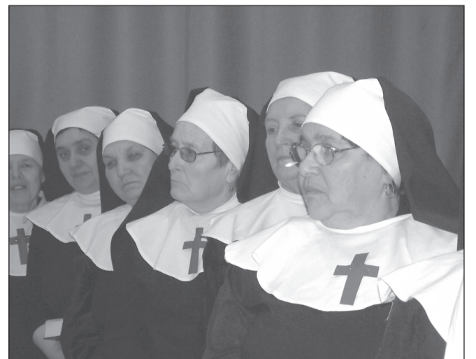
Színpadon az apáca jelmezes hölgyek