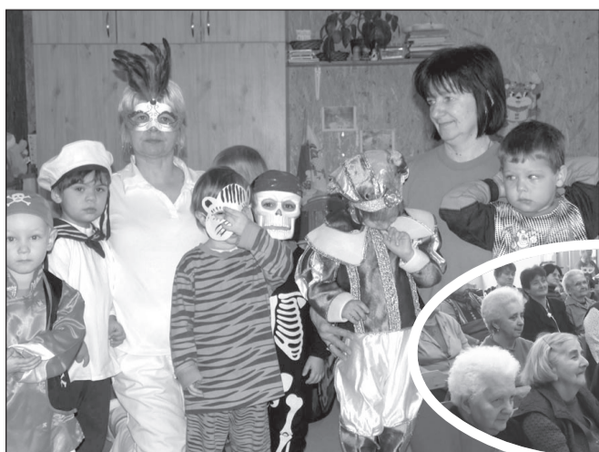
A bölcsőde Napocska csoportja

Itt a farsang, haja huj, Ne lássunk most szomorú! Mert a farsang februárban