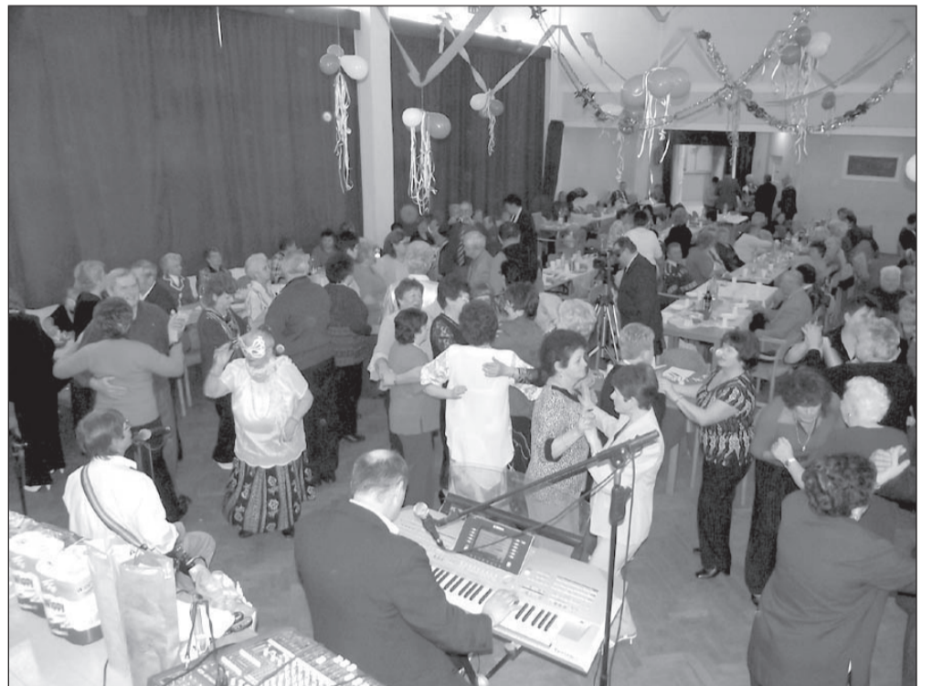
A Bartók Béla Művelődési Központ nagytermében több mint kétszázan voltak

Kutatók szerint a farsang elnevezése és a legrégebbi szokásadatok középkori német polgári hatásra vallanak, de vannak Mátyás király udvarából itáliai hatásra utaló adatok is. Tehát jóval több, mint 500 éves hagyományt ápoltak (Hunyadi Mátyás magyar király 520 éve halott) februárban a sarkadi farsangolók. Már hírt adtunk a város óvodásainak, általános iskolásainak farsangi multságáról, most a többi farsangi rendezvényről nyújtunk összefoglalót.