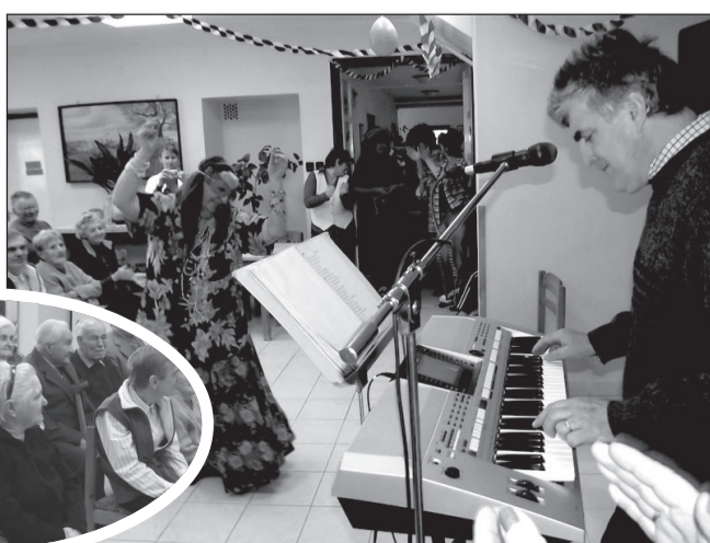
A Gyulai úti Szociális Otthonban