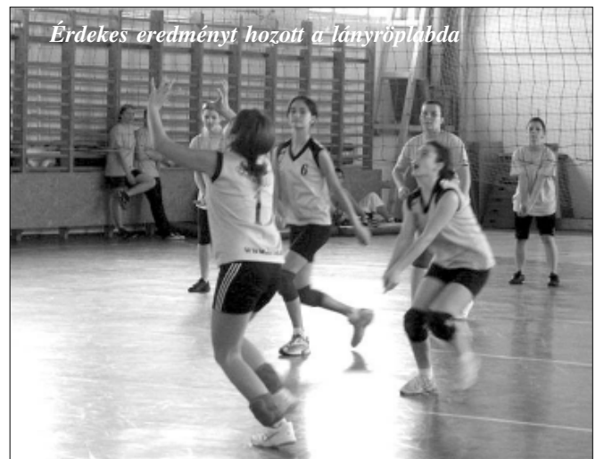
Érdekes eredményt hozott a lányröplabda