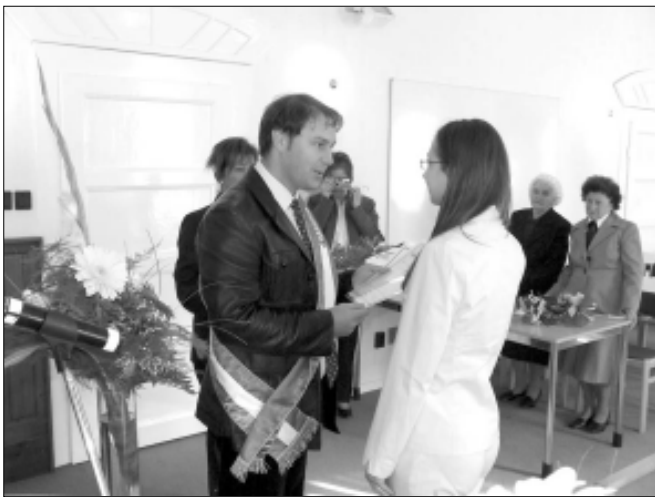
Magyar állampolgárrá fogadás a sarkadi Polgármesteri hivatalban (archív kép)

Az állampolgársági kérelmet (2011. 01. 01-től) egyénileg és csak személyesen, a korlátozottan cselekvőképességű, illetőleg cselekvőképtelen személy nevében törvényes képviselője terjesztheti elő. Kérelmet az nyújthat be, aki a kedvezményes honosítás következő (együttes) feltételeinek maradéktalanul megfelel: