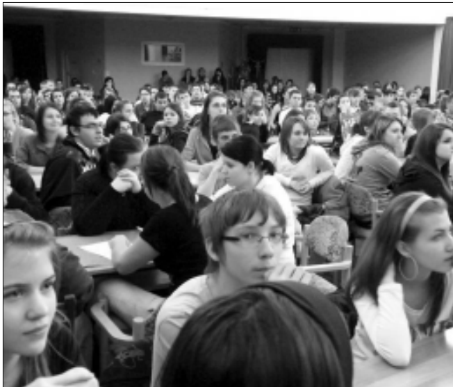
Akikért létre jött az Ady-hét - diákok a nézőtérén