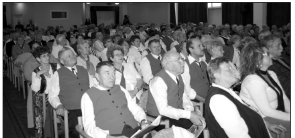
A közönség, a zeneértő hallgatóság

tera segítségével jutott el abba a világba, melynek története egyidős az emberrel. A zenei hang, a ritmus ősidők óta az emberi lélek tápláléka és a dobok világától napjainkig a lényege talán alig változott. Egy olyan közös világnyelv, amelyet szinte minden ember ért. A zene képes mondanivalót közvetíteni azok számára, akik képesek befogadni, és mint pedagógus szeretném – mondta, ha a fiatalok közül minél többen kerülnének a zeneértők táborába. Örömmel tölt el, hogy Sarkadra ennyi zeneszerető ember jött el, kívánom, hogy nyújtsanak egymásnak