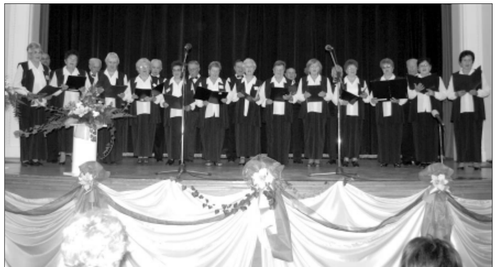
A házigazdák Gyöngyike női- és a Fehér Kakasok férfi kórusa közös fellépése

A sarkadi Nyugdíjasok Érdekvédelmi Egyesülete szervezésében október 15-én a Bartók Béla Művelődési Központban került sor a IV. Nemzetközi Kistérségi Nyugdíjas Dalos Találkozóra. Tehát immár negyedik alkalommal nyújtanak lehetőséget a város, a kistérség és a határon túlról érkező nyugdíjasoknak arra, hogy énekhangjukat, előadói képességüket megmutathassák. Egyre szélesebb a fellépők köre (Nagyvárad és Nagyszalonta nyugdíjasai, nótafái is eljöttek) és velük együtt a műfajok köre is bővült. Tíz kórus és szólóisták sora lépett színpadra, összesen közel 200 fő. Felcsendültek népdalok, virágénekek, magyar nóták, operettek, hazafias dalok, és népszerű slágerek is.