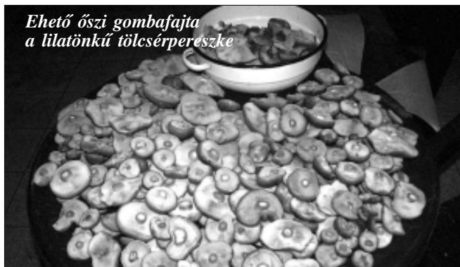
Ehető őszi gombafajta a lilatönkű tölcserpereszke