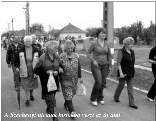
A Széchenyi utcaiak birtokba veszi az új utat

Önkormányzati intézményvezetői közlemény