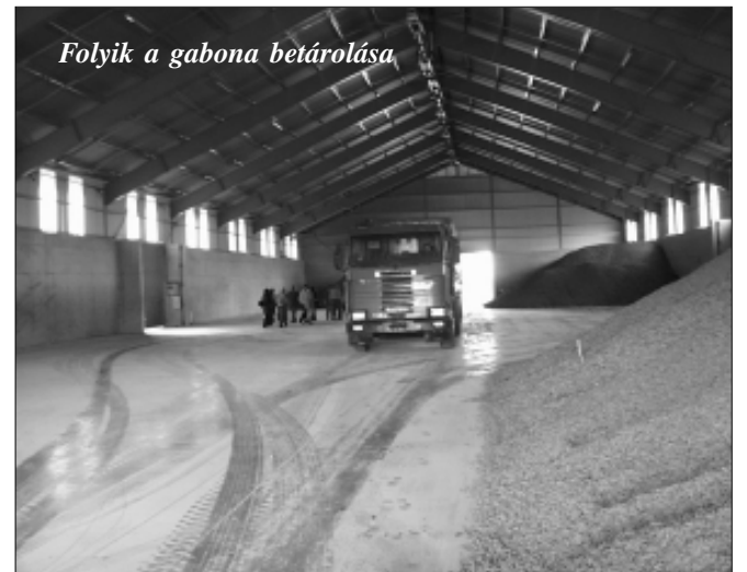
Folyik a gabona betárolása

- a földtulajdon értékének megőrzése, a földtulajdontól való megszabadulás szándékának fékezése, ezáltal értékes nemzeti kincsünk megtartásához hozzájárulás, - az agrárium növénytermesztési végtermékeinek biztos felvásárlása, a piac ki-