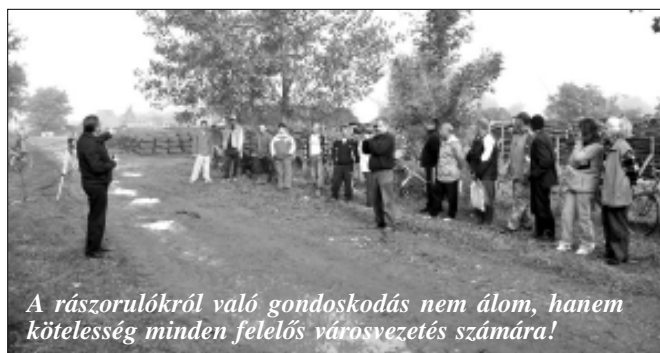
A rászorulókról való gondoskodás nem álom, hanem kötelesség minden felelős városvezetés számára!

Népjóléti Osztályának szakemberei sajnos ismét meg kellett állapítani, hogy egyre több sarkadi család került önhibáján kívül olyan nehéz helyzetbe, mely eredményeként megoldhatatlan problémává vált a megfelelő fűtés biztosítása a rövidesen induló fűtési szezonban. Azonban ennek a problémának a kezelésére is - Békés megye települései közül egyedülálló módon - tud Sarkad Város Önkormányzata lépéseket tenni, ugyanis nagyon sok magyarországi településsel szemben nemcsak nem adósodott el, hanem felelősen gazdálkodott és gazdálkodik vagyonaival, tervszerűen művelte és műveli földjeit, telepítette és telepíti erdőit, illetve termeli ki több száz közmunkása segítségével ezekből a tűzrevalót, s így képes segíteni a város leginkább rászoruló lakosain.