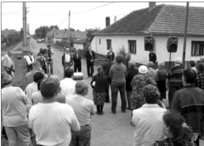
A Széchenyi utca új útburkolatának átadása