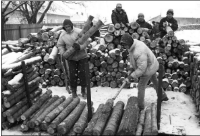
A januári faosztás sem mehetett volna zökkenőmentesen közfoglalkoztatottak nélkül

Sarkadon is – ahogy egész Békés megyében, sőt az egész Dél-alföldi régióban – alapvető problémát jelent a munkanélküliség. A munkanélküliség kérdésének megoldására két módon tud lépéseket tenni az önkormányzat. Egyrészt törekszik a helyi gazdaság élénkítésére, s vállalkozókkal, befektetőkkel tárgyalva újabb munkalehetőségek létrehozását segíti elő, ahogy történt ez a cipzárgyár, illetve a gabonapark Sarkadra csalogatása során, másrészt a közfoglalkoztatás lehetőségeit kihasználva próbálja foglalkoztatni, s így keresethez juttatni a munkanélkülieket. Jelen írásunk a közfoglalkoztatás terén tett önkormányzati eredményeket kívánja bemutatni!