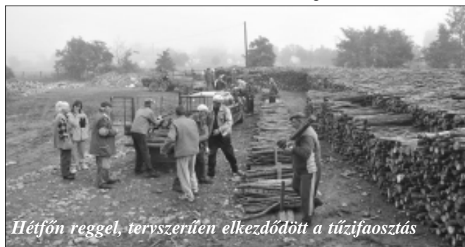
Hétfőn reggel, tervszerűen elkezdődött a tűzifaosztás