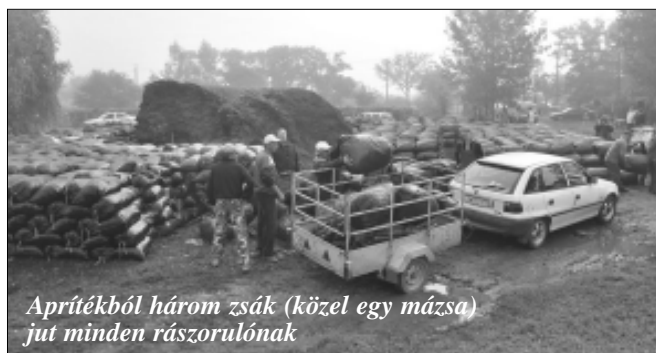
Aprítékból három zsák (közel egy mázsa) jut minden rászorulóknak