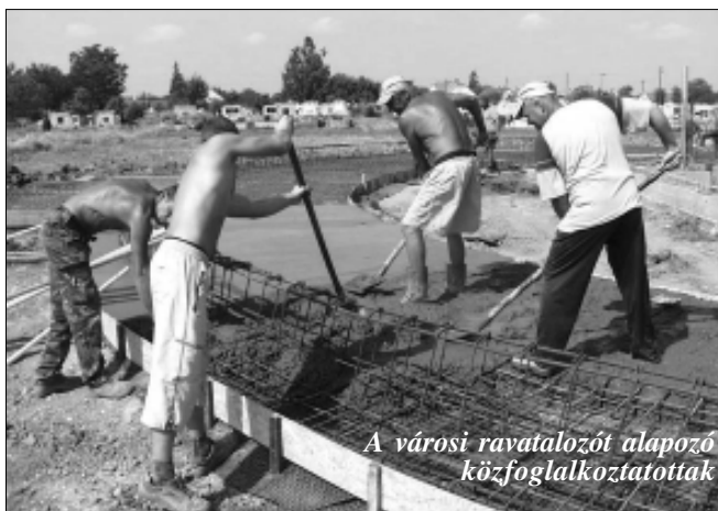
A városi ravatalozót alapozó közfoglalkoztatottak

Összességében megállapítható, hogy az év első felében a közfoglalkoztatási tervben meghatározott célok teljesültek. Sarkad Város Önkormányzata a munkanélküliek foglalkoztatása mellett – korábban is és jelenleg is – továbbra is elkötelezett, s a