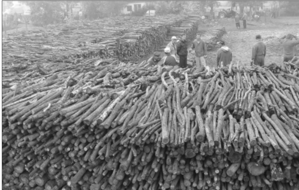
A Városgazdálkodási Iroda munkatársai által gondosan „betermelt” és szétosztásra váró faanyag

2010. szeptember 13-án, hétfőn elkezdődött az a program, mely keretében nyolc napon át, szervezett keretek között, a Polgármesteri Hivatal Népjóléti Osztályának és a Városgazdálkodási Iroda munkatársainak közreműködésével több, mint 2.600 szociálisan rászoruló, hátrányos helyzetű sarkadi lakos (Sarkad lakosságának majdnem 25%-a!), összességében több mint 1000 sarkadi háztartás kap tűzifát az önkormányzattól a közelgő téli fűtési nehézségek enyhítésére.