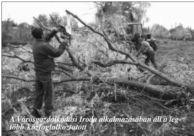
A Városgazdálkodási Iroda alkalmazásában áll a legtöbb közfoglalkoztatott