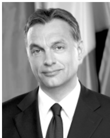
Orbán Viktor miniszterelnök