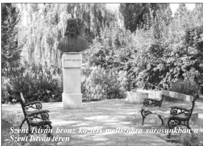
Szent István bronz közterti mellszobra városunkban a Szent István téren