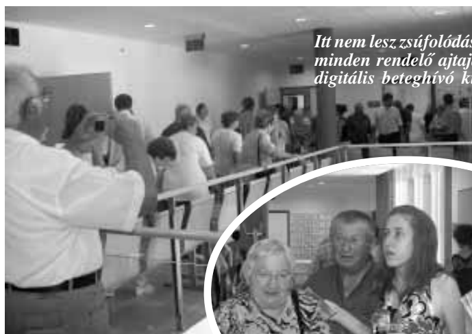
Itt nem lesz zsúfolódás, tokolódás, mert minden rendelő ajtaja fölött ott a digitális beteghívó kijelzője