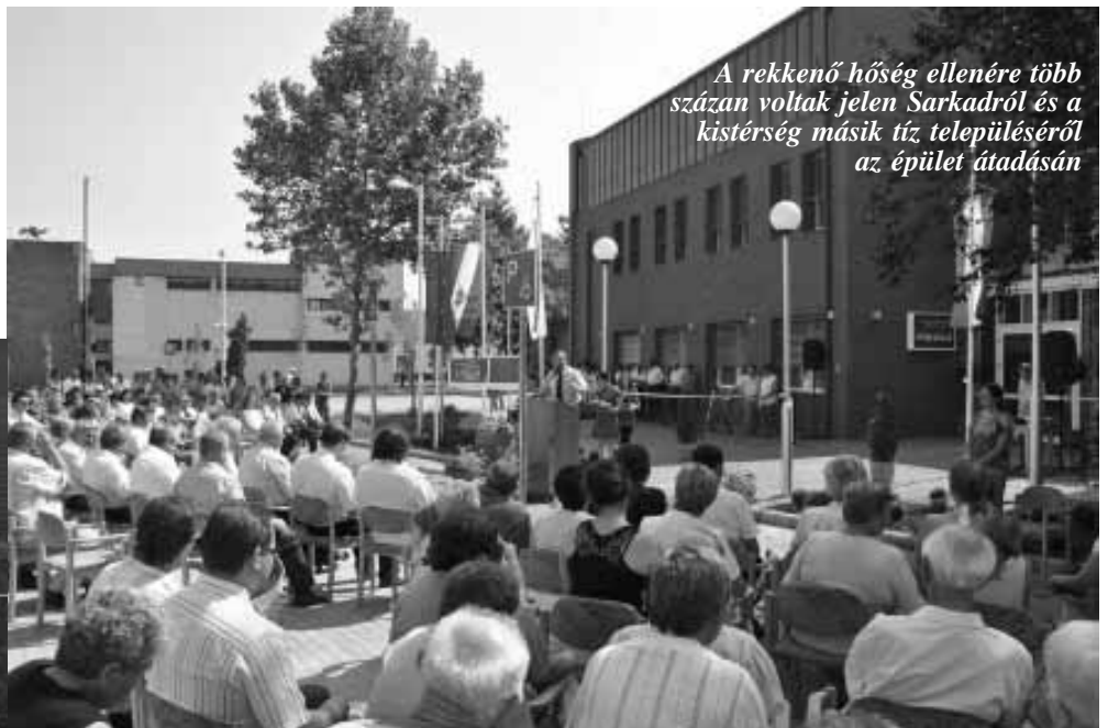
A rekkenő hőség ellenére több százán voltak jelen Sarkadról és a kistérség másik tíz településéről az épület átadásán