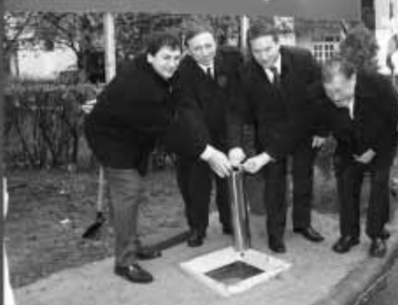
Az alapkö elhelyezésének boldog pillanatai 2009. november 5-én

Magyarországi Unió támogatásával, az Európai Regionális Fejlesztési Alap társfinanszírozásával valósul meg.