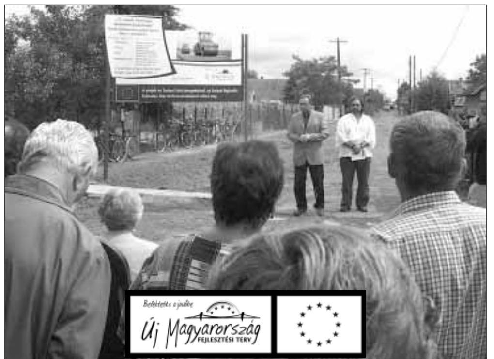
Régi álma valósul meg a Széchenyi utcai lakosoknak, amikor elkészül az új útburkolat

2010. július 26-án került sor a városunk öt utcáját érintő útfelújítás - útépités ünnepélyes projektnyitójára!