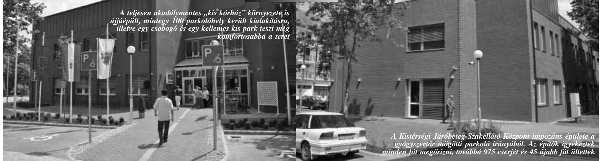
A Kistérségi Járóbeteg-Szakellátó Központ impozáns épülete a gyógyszerár mögötti parkoló irányából. Az építők igyekeztek minden fát megőrizni, továbbá 975 cserjét és 45 újabb fát ültettek