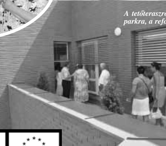
A tetőteraszról szép kilátás nyílik a „kis korház” körül elhelyezett parkra, a református templomra és a Kossuth utca épületeire