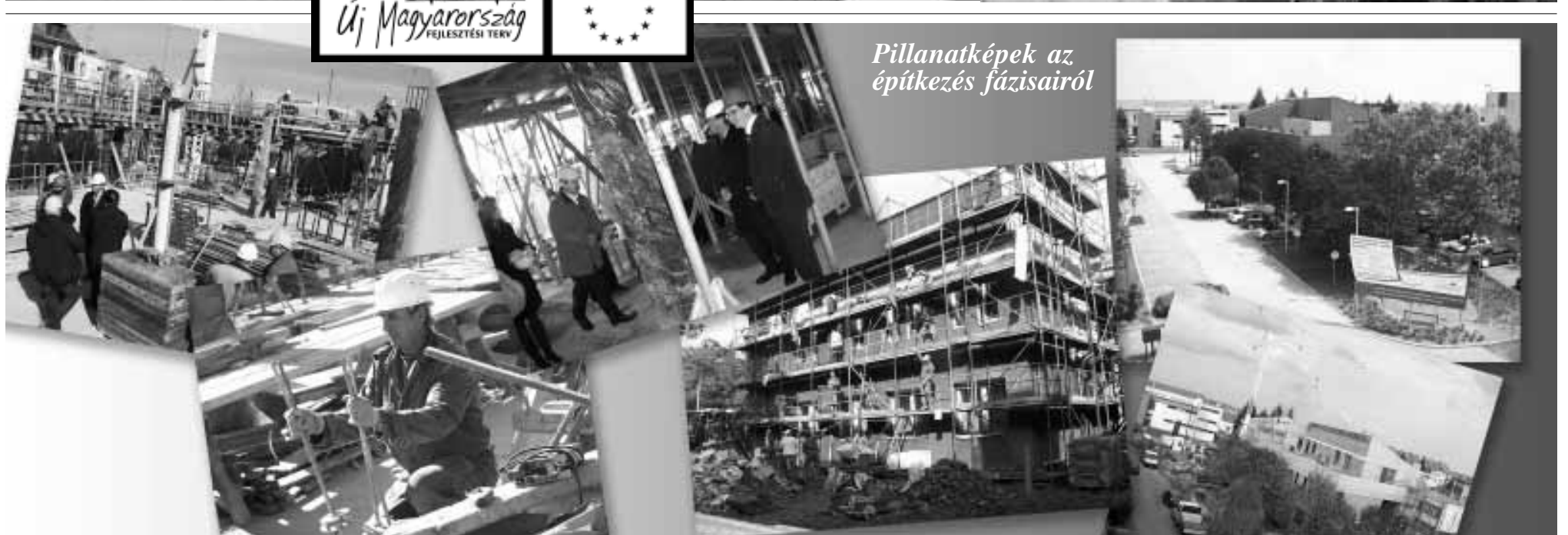
Pillanatképek az építkezés fázisairól