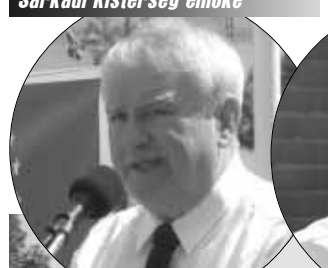
Dr. Kovács József országgyűlési képviselő

Az arcokon kivétel nélkül öröm és csodálat volt látható, amikor az egészséget, illetve az ebből eredő jobb életminőséget szimbolizáló épület folyosóin végigsétáltak. Az épület megtekintése és a boldog percek közepe jutott, hogyha a Sarkadi Kistérség „életére-létére” törő MSZP-s indítvány győzedelmeskedik, és nem védjük volna meg a kistérséget három évvel ezelőtt, akkor kistérség híján ez a „kis kórház” soha sem épülhetett volna meg a kistérséget alkotó tizenegy település számára, s ez az átadónapszegen sem lett volna!