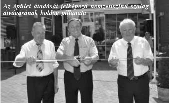
Az épület átadását jelképező nemzetiszínű szalag átvágásának boldog pillanata

2010. július 23-án került sor annak az épületnek az átadására, amely - majd 1 milliárdos beruházás keretében - össze tervezett egészségügyi szolgáltatásának megnyitásától teljesen új alapokra helyezi az ország egyik leghátrányosabb helyzetű