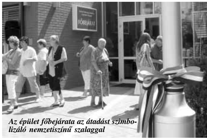
Az épület főbejárata az átadást szimbolizáló nemzetiszínű szalaggal

Aki ott volt az épületátadáson és bejárta az épületet, az személyesen is meggyőződhetett arról, hogy a 19 szakellátást biztosító Kistérségi Járóbeteg-Szakellátó Központ épülete a legmodernebb technológiával, az építészet XXI. századi elvárásainak megfelelően épült. A háromszintes épület teljes egészében légkondicionált, fűtéséről és hűtéséről a legmodernebb léghőszivattyús rendszer gondoskodik, tehát se kéményt, se gázórát ne keressünk rajta.