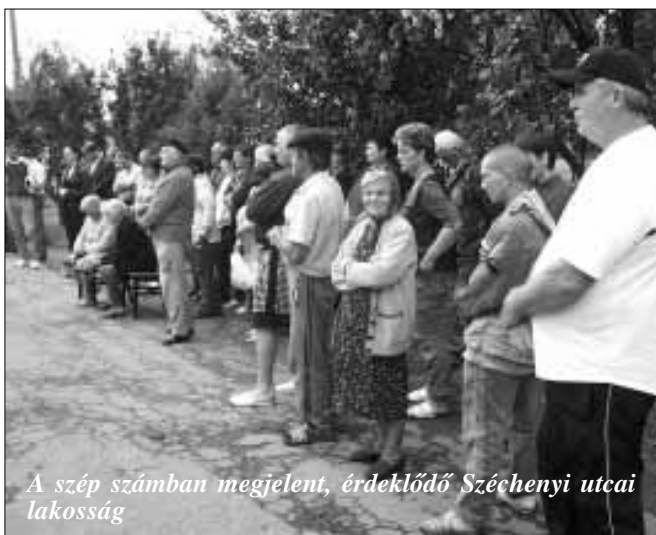
A szép számban megjelent, érdeklődő Széchenyi utcai lakosság