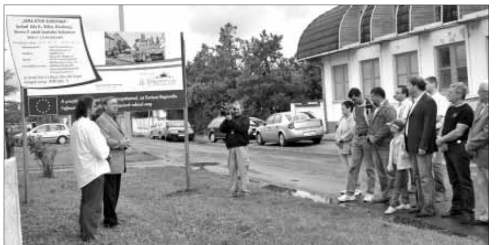
Projektnyitó a Kossuth utca - Bihar utca kereszteződésében