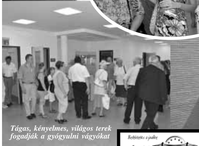
Tágas, kényelmes, világos terek fogadják a gyógyulni vágyókat