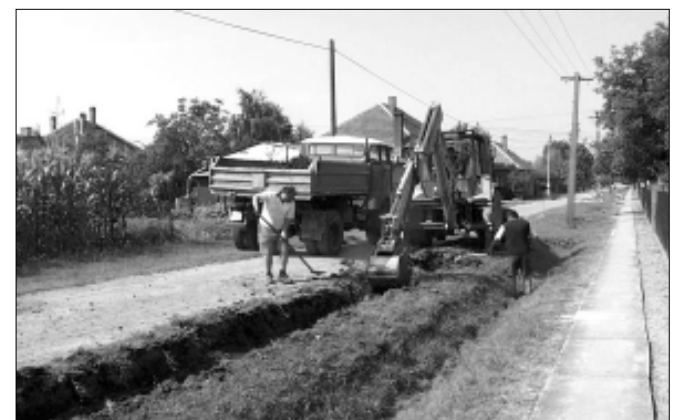
A Széchenyi utcai szilárdburkolatú útépítés előkészületi munkálatai