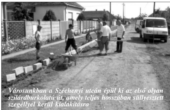
Városunkban a Széchenyi utcán épül ki az első olyan szilárdburkolatú út, amely teljes hosszában szilárdított szegéllyel kerül kialakításra