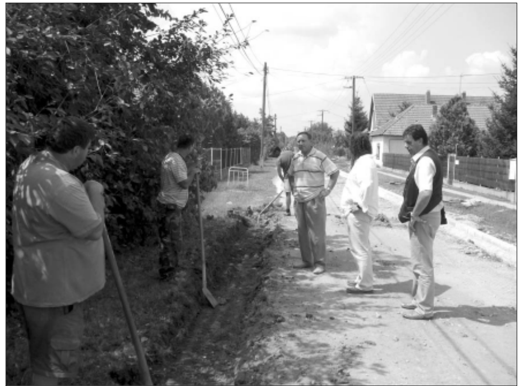
Jól halad a Széchenyi utcai útépítés, szemle