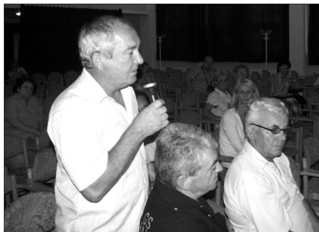
Az Ady Endre utca egy lakója köszönetet mond az önkormányzatnak az útburkolat felújításáért