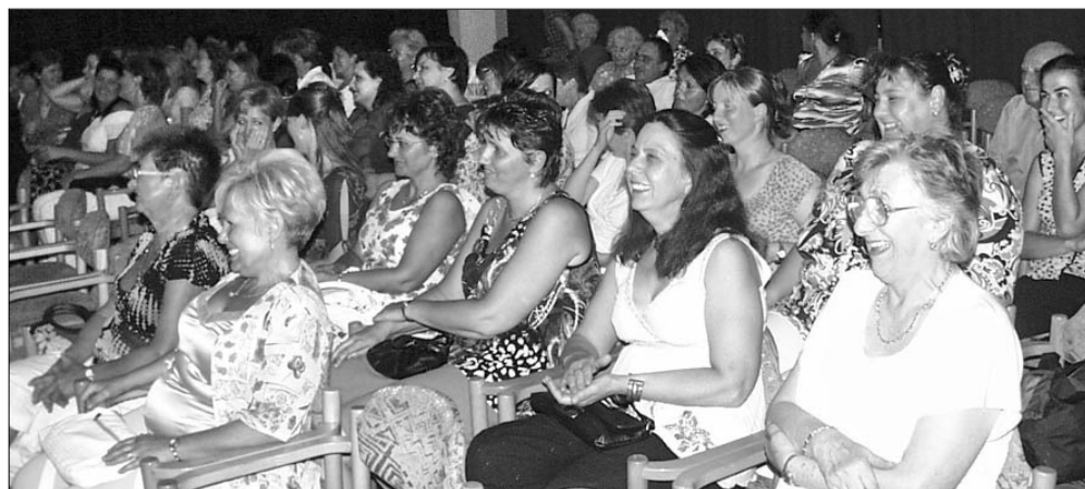
A kulturális műsor bővelkedett derűs pillanatokban

KHSZK Családsegítő és Gyermekjóléti Szolgálat