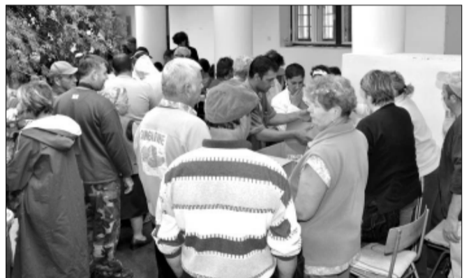
Az adományosztás pillanatai

Sarkad Város Önkormányzatának kérésére és szervezésében az Európai Unió a Magyar Élelmiszerbank Egyesületen keresztül, a Szent László Szolgálat Alapítvány közreműködésével városunkba élelmiszersegély szállítmányt juttatott el, melynek a rászoruló lakossághoz való szétosztásáról városunk önkormányzata gondoskodott.