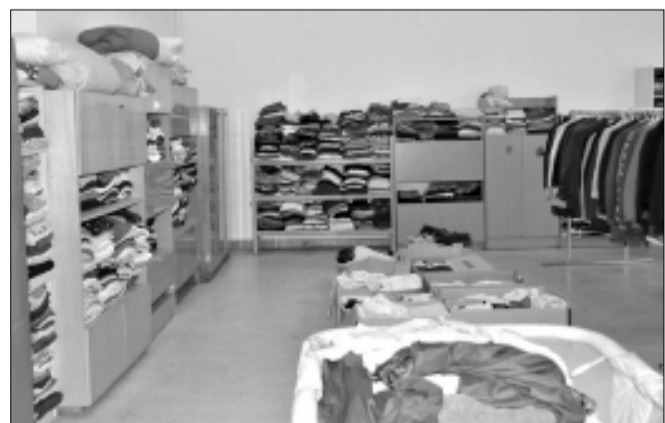
Ruhák, cipők, bútorok a rászorulóknak