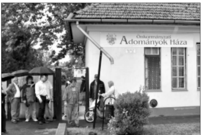
2010. június 21-én megnyitott az Önkormányzati Adományok Háza

Sarkad Város Önkormányzatának Képviselő-testülete köszönetét fejezi ki a Város-