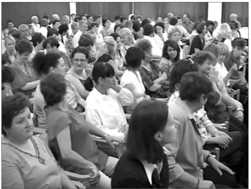
Városunk pedagógusai színiünnepig megtöltötték a Művelődési Központ nagytermét

„Ha hajót akarsz építeni, ne azzal kezd, hogy a munkásokkal fát gyűjtesz és szó nélkül kiosztod közöttük a szerzőszámokat, és rámutatsz a tervrajzra. Ehelyett először keltsd fel bennük az olthatatlan vágyat a végtelen tenger iránt.” (Antoine de Saint-Exupéry)