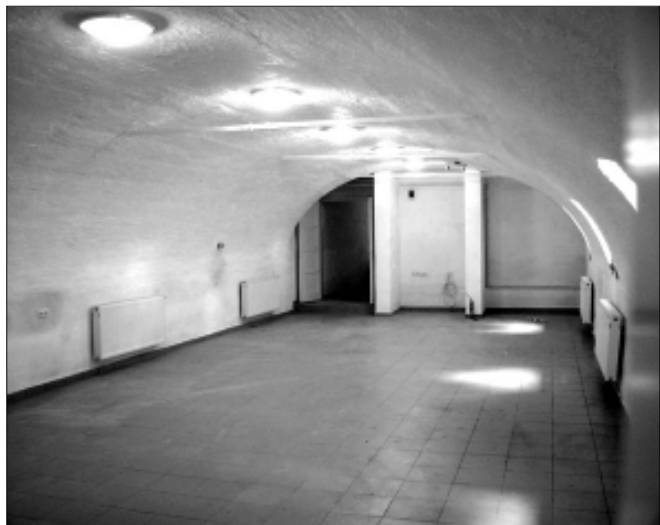
A boltívés belső tér klubhelyiségként lesz hasznosítva