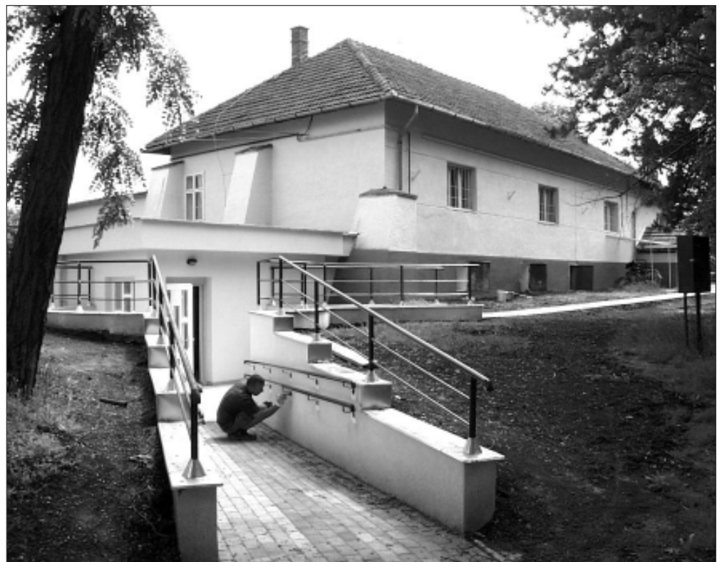
Utolsó „símütások”: akadálymentes használatot biztosító rámpa biztonsági korlátjának festése