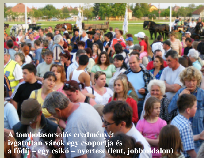
A tombolasorsolás eredményét izgatottan várók egy csoportja és a fődj - egy csikó - nyertese (lent, jobb oldalon)