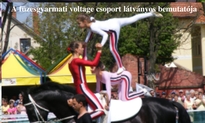
A fűzesgyarmati voltage csoport látványos bemutatója