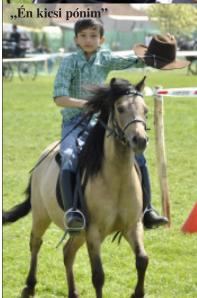
„Én kicsi pónim?”