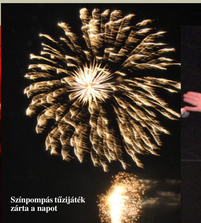
Színpompás tűzijáték zárta a napot