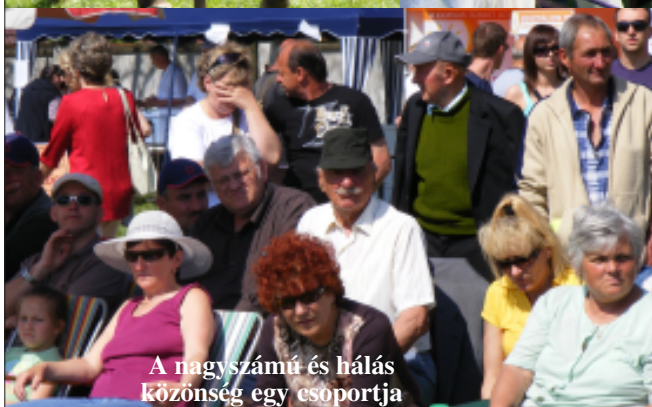
A nagyszámú és hálás közönség egy csoportja