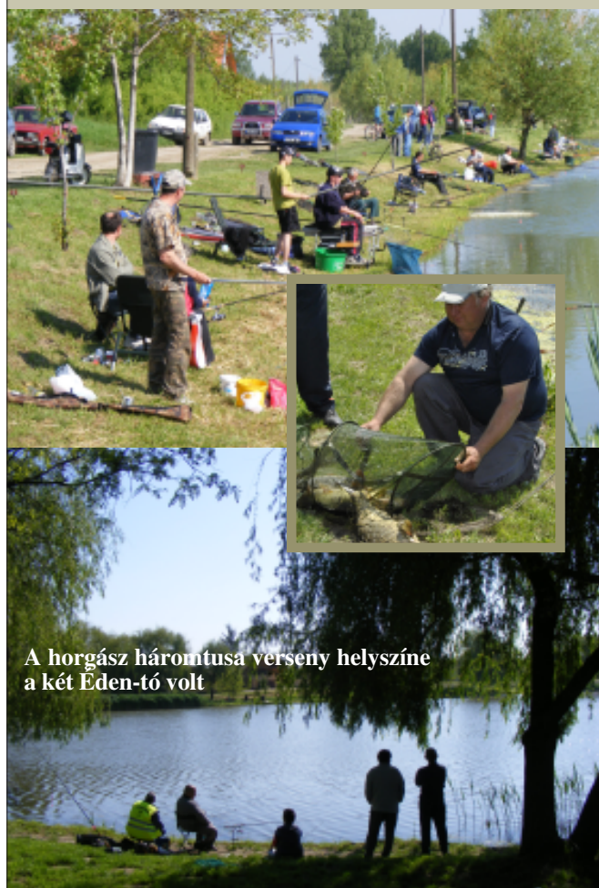
A horgász háromtusa verseny helyszíne a két Eden-tó volt