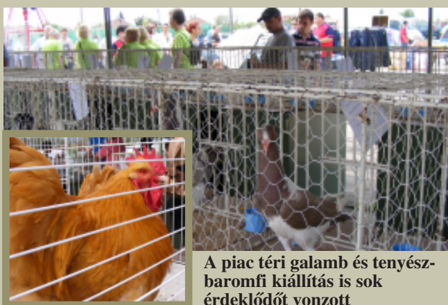
A piac téri galamb és tenyészbarmfi kiállítás is sok érdeklődőt vonzott