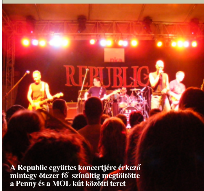
A Republic együttes koncertjére érkező mintegy ötezer fő színültig megtöltötte a Penny és a MOL kút közötti teret