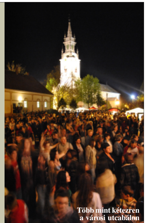
Több mint kétezeren a városi utcabálon