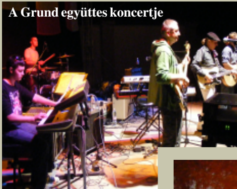
A Grund együttes koncertje