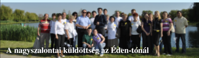
A nagyszalontai küldöttség az Éden-tónál