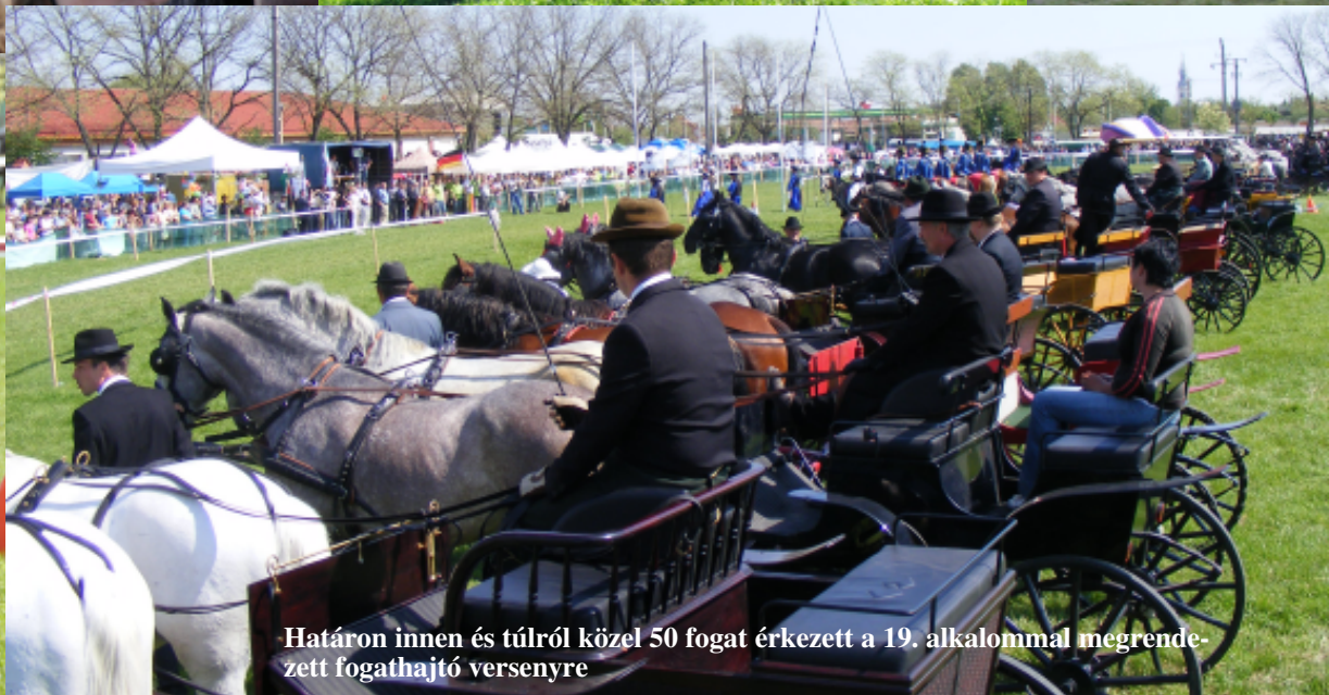
Határon innen és túlról közel 50 fogat érkezett a 19. alkalommal megrendezett fogathajtó versenyre