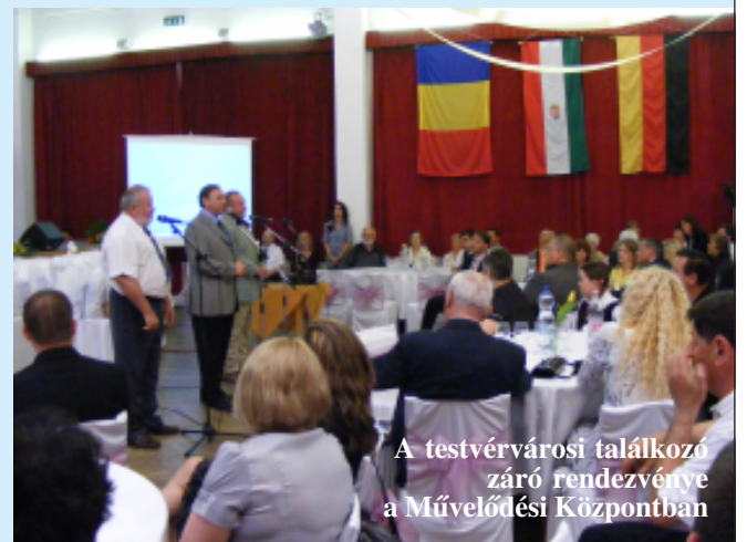
A testvérvárosi találkozó záró rendezvénye a Művelődési Központban