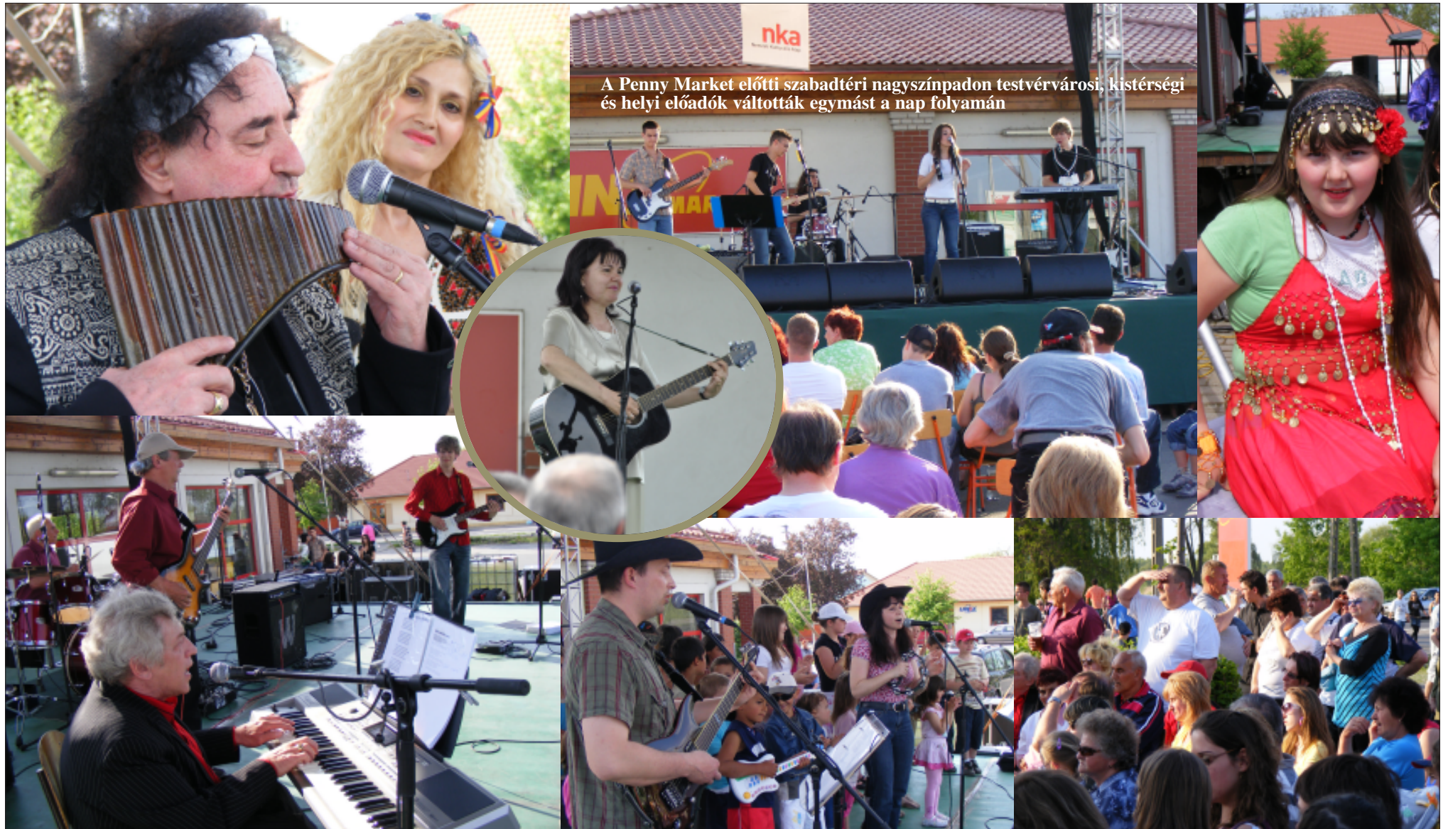
A Penny Market előtti szabadtéri nagyszínpadon testvérvárosi, kistérségi és helyi előadók váltották egymást a nap folyamán