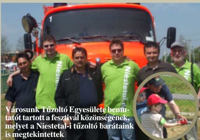
Városunk Tűzoltó Egyesülete bemutatót tartott a fesztivál közönségének, melyet a Niestetal-i tűzoltó barátaink is megtekintettek