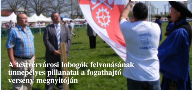
A testvérvárosi lobogók felvonásának ünnepélyes pillanatai a fogathajtó verseny megnyitóján