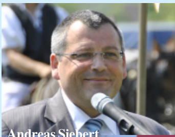
Andreas Siebert polgármester