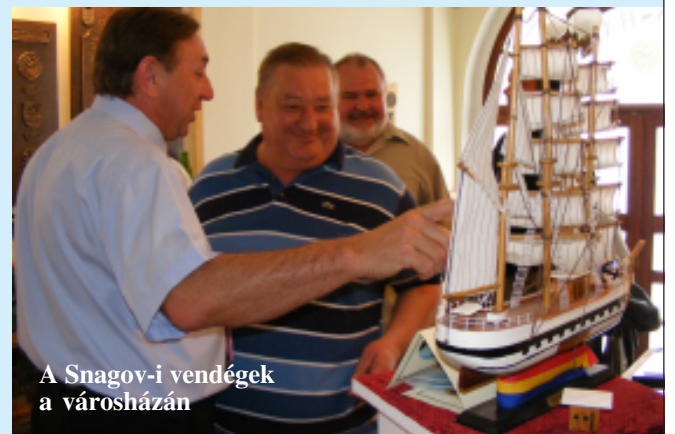
A Snagov-i vendégek a városházán