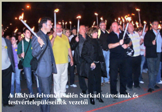
A fáklyás felvonulás élén Sarkad városának és testvértelepüléseinek vezetői