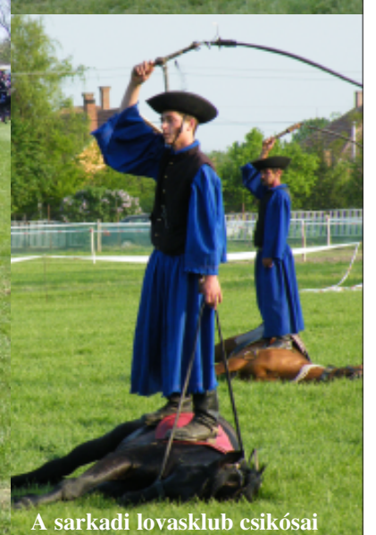
A sarkadi lovasklub csikósai