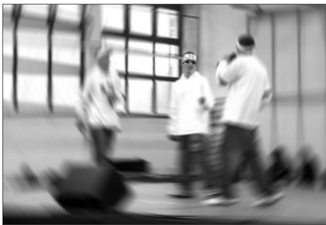
... és a repperek