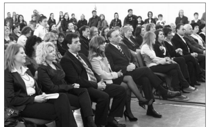
A nézőtéren a város vezetése is helyet foglalt