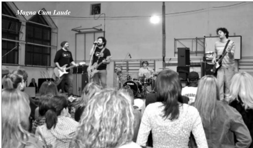
Magna Cum Laude