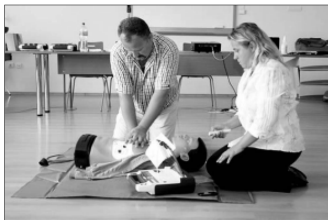
Életmentési bemutató gyakorlat

A március 11-ei délelőtti mozgalmassabb volt, mint egy átlagos nap a rendelőben. Mentősök és orvosok együtt küzdöttek egyszerre két emberi életért.