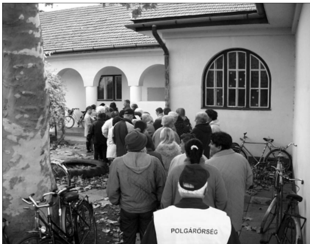
„Önkormányzati Adományok Háza” a régi újteleki kisiskolában fog berendezkedni

Ennek a karitatív intézménynek a beindításában, és a sikeres működtetésében