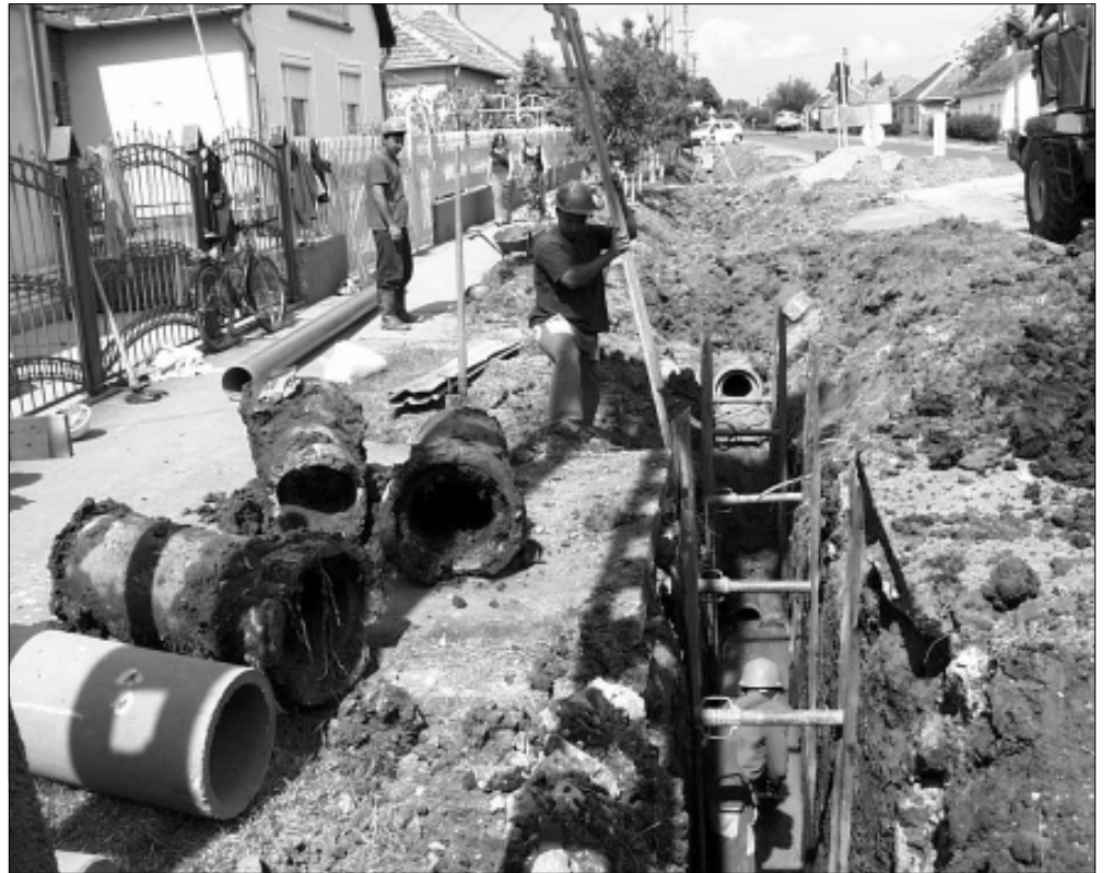
A Gyulai út csatornát építik (archív- 2004.)