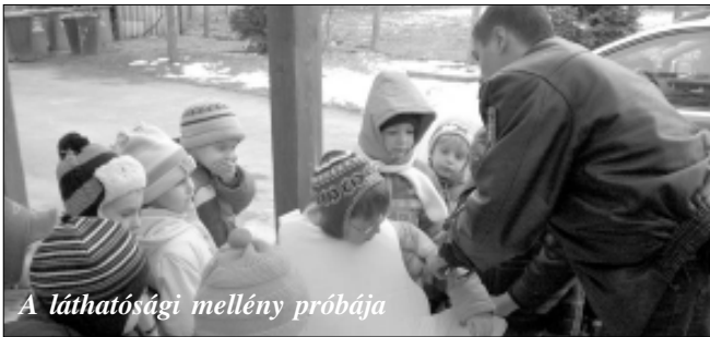
A láthatósági mellény próbája