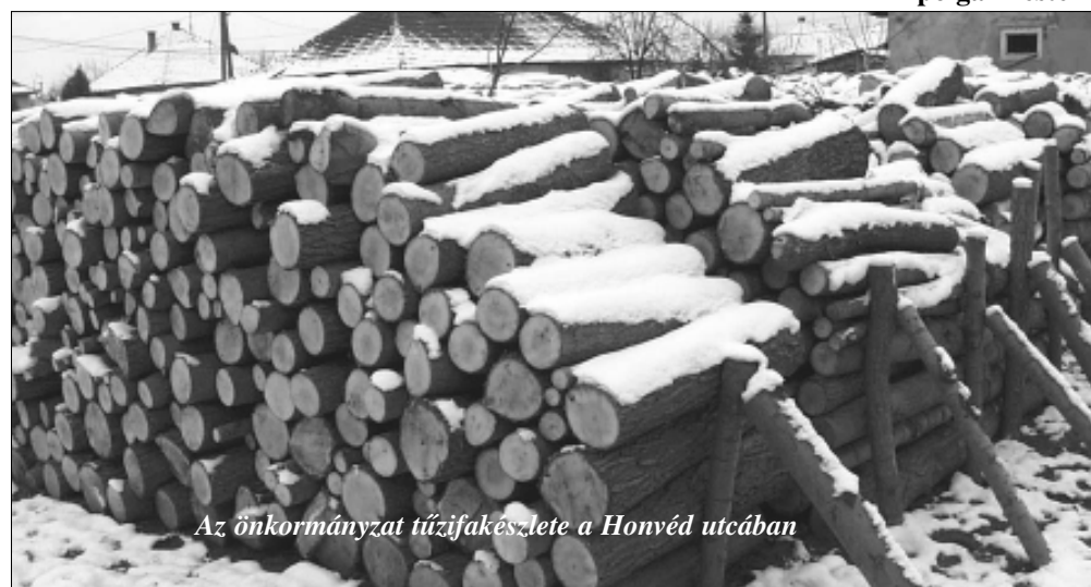
Az önkormányzat tűzifakészlete a Honvéd utcában