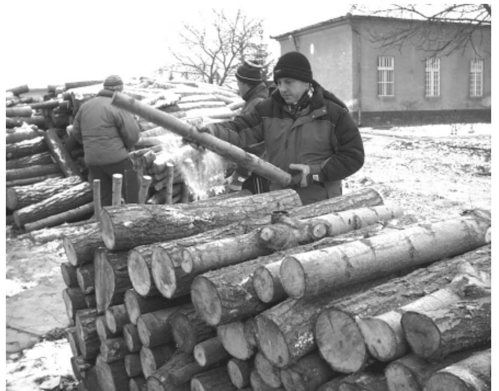
Már a február elsejei szállításokhoz „köbméterezik” a fát