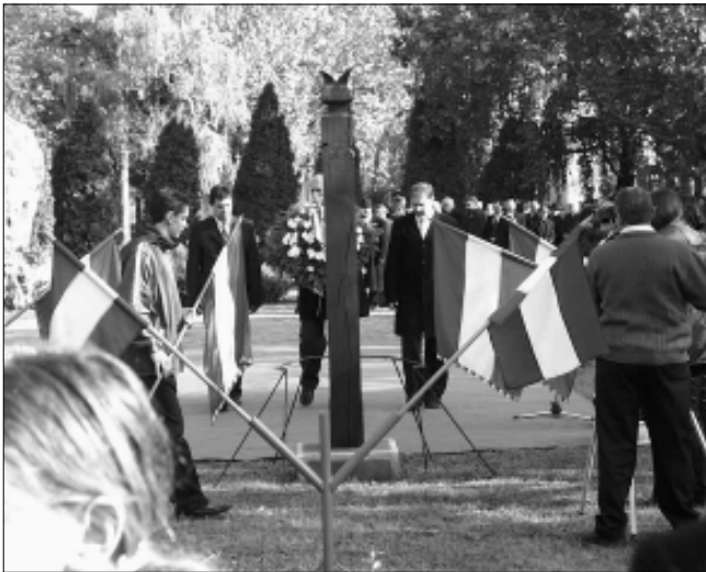
A város vezetése ( a képen ) és valamennyi állami, társadalmi szervezet elhelyezte az emlékezés virágait, koszorúit

Miért voltak HŐSÖK? Azért mert egy hazug korszakban ki mertek állni az igazságért! Azért, mert szembe mertek nézni a vörös hadsereg tankjaival, és az ÁVH-