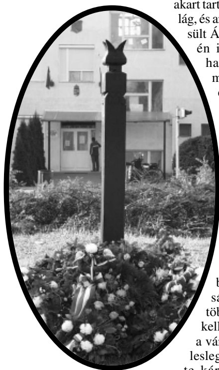
Virágdíszben az '56-os emlékhelyünk a Vértanúk terén

A magyar lelkekben őrzött szabadságnak ezt követően több mint harminc évig kellett még várni, ám ez a várakozás nem volt felesleges. 1989-ben, szinte kártyavárként omlott össze az örökéletűre tervezett kommunista rendszer, legfőbb jelképével, Szovjetuni-