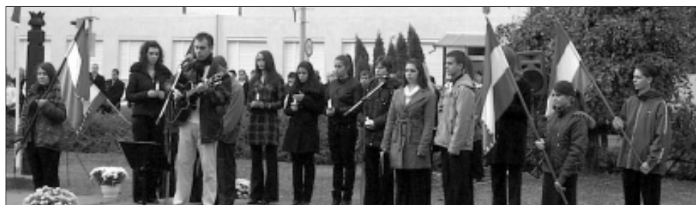
Irodalmi emlékműsort az Ady Endre Bay Zoltán Középiskola és Kollégium diákjai és tanárai állítottak össze