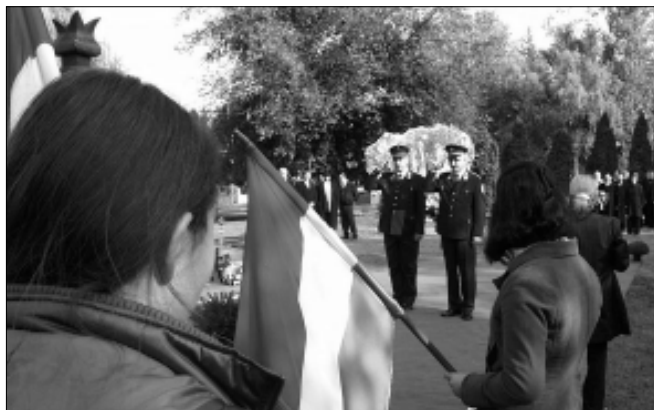
Állami fegyveres testületeink vezetői tisztelegve emlékeztek

En most a sarkadi '56-os kopjafa mellől azt kérdezem országunk vezetőitől: NEM FÉLNEK, HOGY ismét '56 LESZ? S azt üzenem nekik, Márai Sándor szavaival élve: „Mert egy nép azt mondta: Elég volt.” —csm