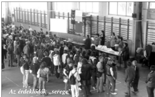
Az érdeklődők „serege”

Nyílt nap, kölcsönös megmutatkozás – bemutatkozás a sarkadi Ady Endre – Bay Zoltán Középiskola és Kollégiumban. Mosolyokkal és reménykedéssel induló – széles mosolyokkal, kacagással és bizakodással záruló hívős októberi nap 2009 októberének 12. napja.