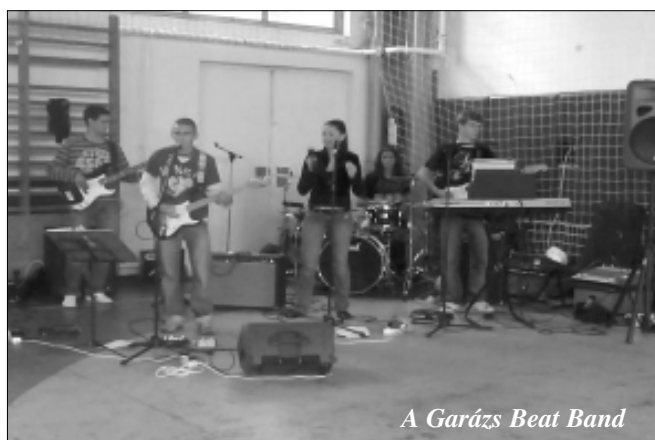
A Garázs Beat Band