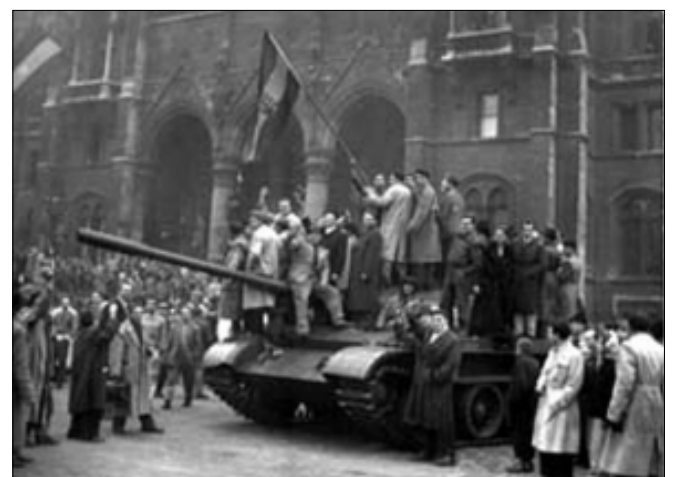
Forradalmárok Budapesten a Parlament előtt