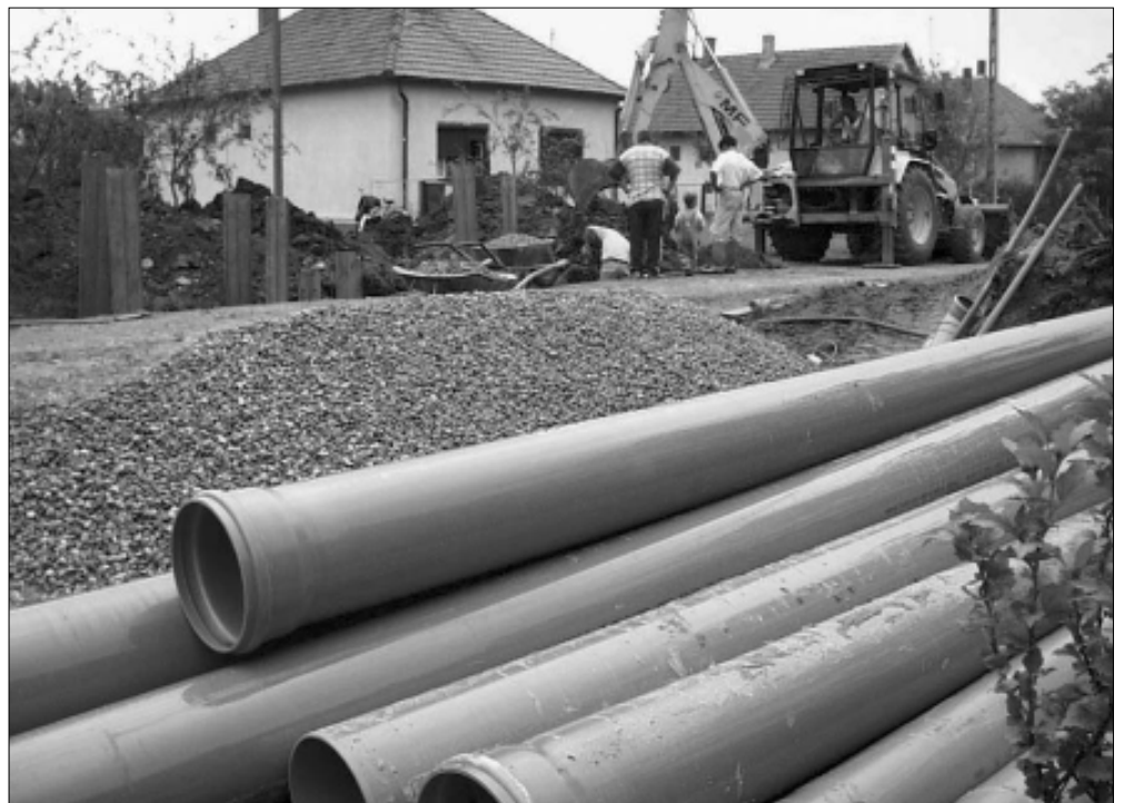
Így kezdődött 2002-ben a szennyvízcsatorna építés városunkban