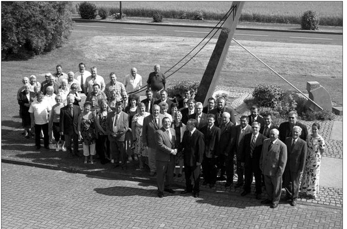
A küldöttség tagjai a Niestetali polgármesteri hivatal előtti emlékműnél, amely Heiligenrode és Sandershausen települések egyesülését jelképezi egy híd formájában.