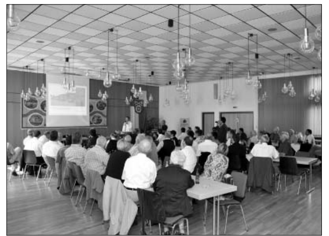
Niestetal polgármestere a sarkadi delegáció számára bemutatja a település folyamatban lévő, milliárdos nagyságrendű fejlesztéseit. A projektsomag tartalmazza a városközpont felújítását és bővítését, a fürdőépítési, a sportpálya építési és az iparfejlesztési programot.