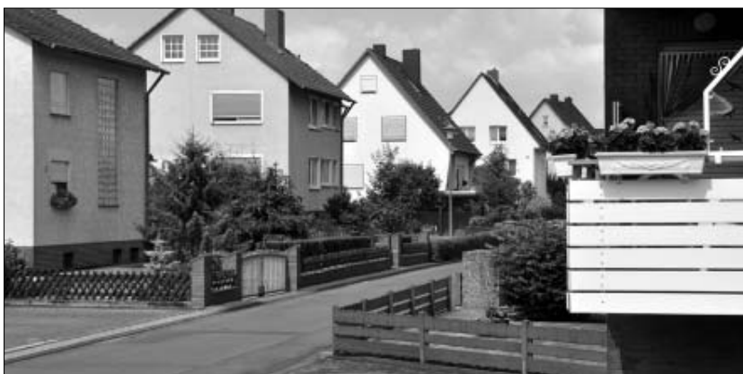
Niestetali utcai látkép. A rendezettség és a tisztaság a német precizitást tükrözi.