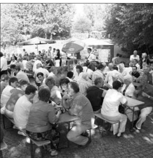
A Niestetali Park fesztiválon ünnepélyesen is köszöntötték Niestetal és a szomszédos Nieste település magyar testvértelepüléseinek (Sarkad és Dunaszentgyörgy) hivatalos önkormányzati küldöttségét.