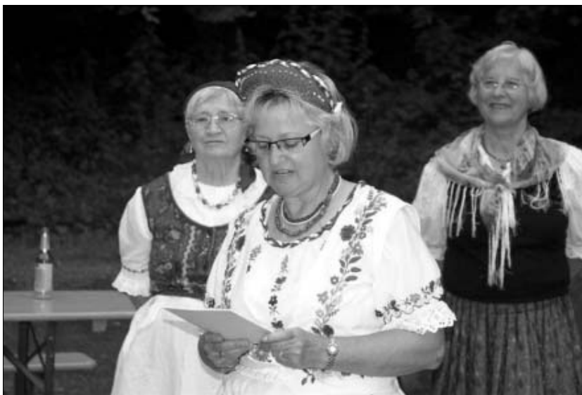
A sarkadi önkormányzati delegációt Niestetalba érkezése alkalmával, majd a következő napi programon is magyar népviseletbe öltözött, magyar származású, helyi lakosok üdvözölték.