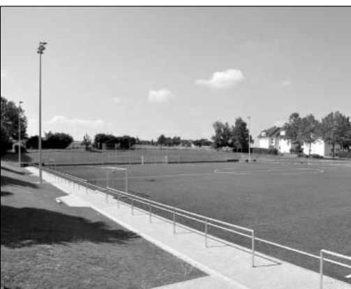
Az újonnan épült Niestetali műfüves pálya és a szomszédságában található sportpálya, ahol a delegáció látogatása alkalmával éppen a tradicionális heiligenrodei futóversenyre került sor.