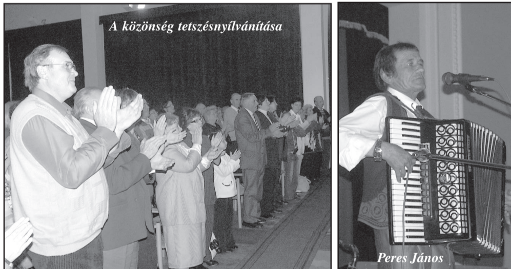
A közönség tetszésnyilvánítása