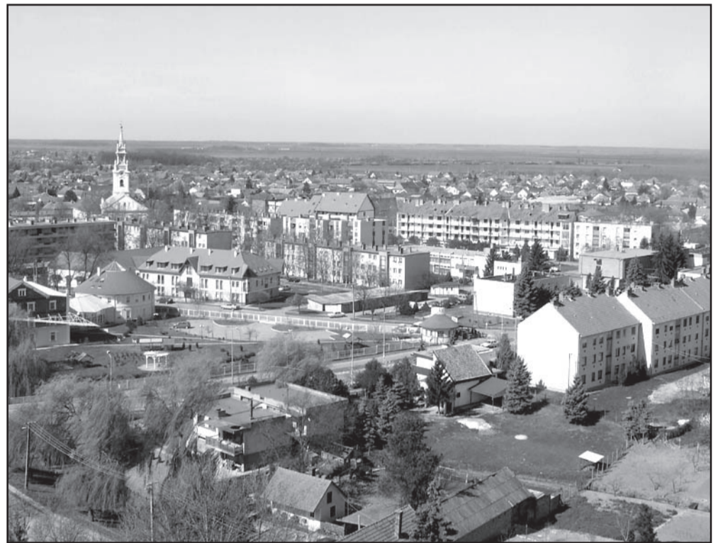
Sarkad város illetékességi területén adókötelezettek az ingatlanok (családi ház, lakás, telek)