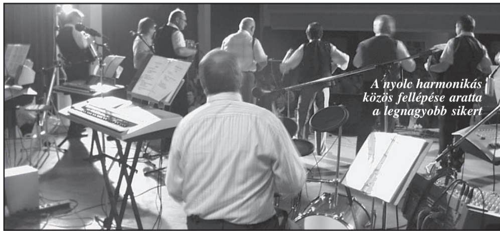
A nyolc harmonikás közös fellépése aratta a legnagyobb sikert