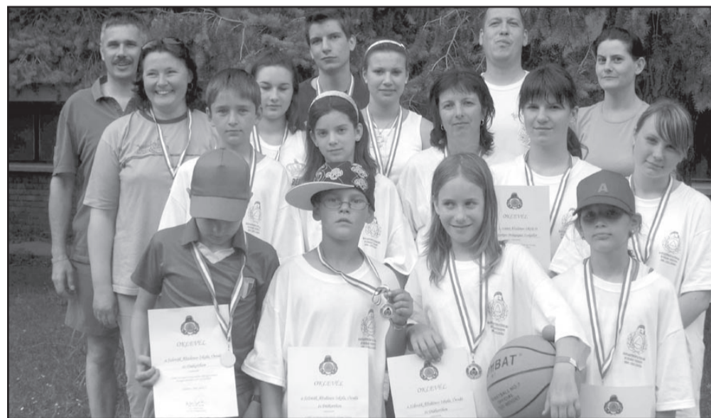
2008-ban az ország legjobbjai között voltak a sarkadi fiatalok