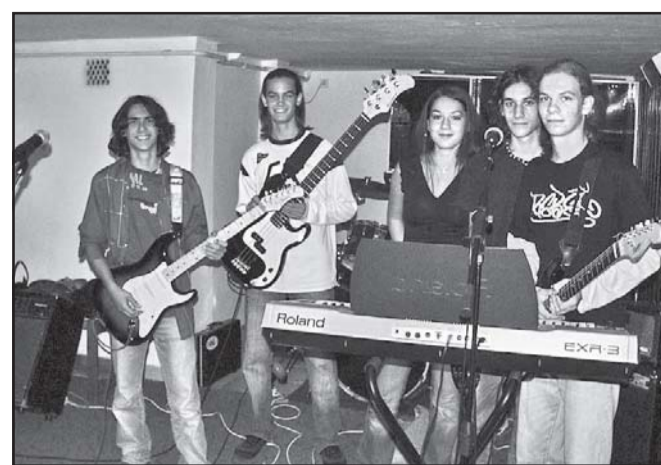
SaRock-ban (Sarkadi Rock Klub) sorozatában az első fellépő a Garage Beat Band volt (archív fotó)

ben mintegy 1,3 Milliós Forintot nyert a Rock Klubot szervező Sarkadi és térségi Ifjúságiért Egyesület. Ezt az összeget 3 kiemelt célra kell kötelezően elkölteni: 400.000 forintot hangtechnikai felszerelések beszerzésére, 500.000 forintot zenekarok fizetésére és - ami talán a legfontosabb - 400.000 forintot költhet az Egyesület egy új klubhelyiség kialakítására. Mindezen feladatok-