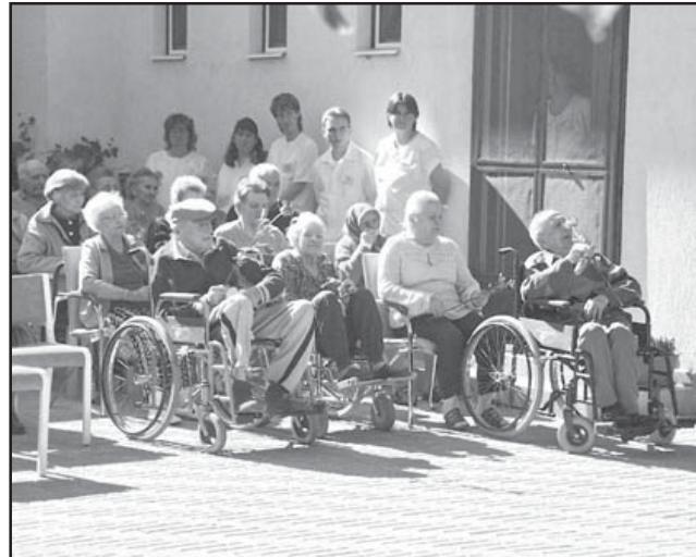
Gondozottak és gondozóik az avató ünnepségen