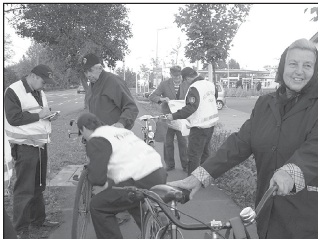
A kerékpárral gyakran közlekedőknek 68 fényvisszaverő tulajdonságokkal rendelkező láthatósági mellényt adtak át

Sarkad Városi Baleset-megelőzési Bizottság