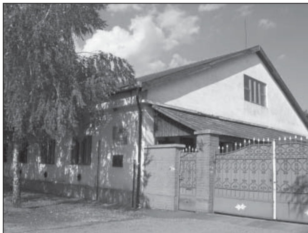
Visszavonták a Sarkadi Bútoripari Szövetkezet dolgozóit elbocsátó leveleket