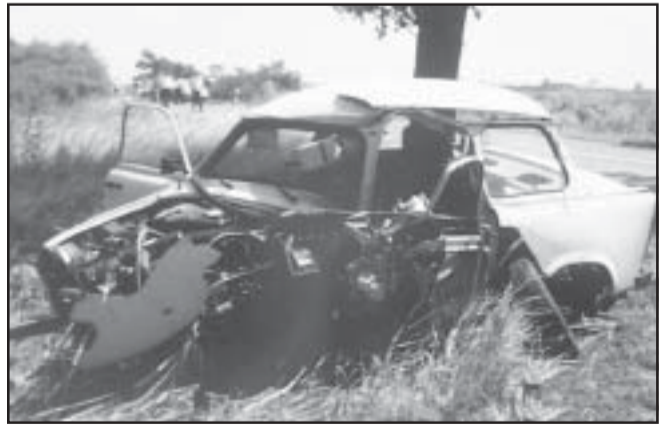
A rendőrség szakemberei a helyszínen

gát tölthő határőr tiszthelyettes Méhkerék felől Sarkad irányába tartott a tulajdonát képező és általa vezetett Trabant 601-es típusú személyautóval, amikor eddig ismeretlen okok miatt letért az út jobb szélére. Ott egy egyedülálló fának ütközött, majd az út menti, 2,5-3 mé-