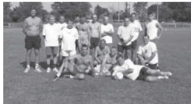
A Szeghalmi csapattal ellen lejátszott teniszmérkőzések után fociban is összemérték erejüket a játékosok

A Kinizsi Tenisz SE az 1999, 2000 és a 2001. évi megyei csapatbajnokságok megnyerése után 2002. évben a második helyen végzett. Az egyesület vezetése a 2002. évi megyei csapatbajnoki eredményeket is kiválóan ítéli és a közvetlen szakmai vezetés értékelését elfogadta.