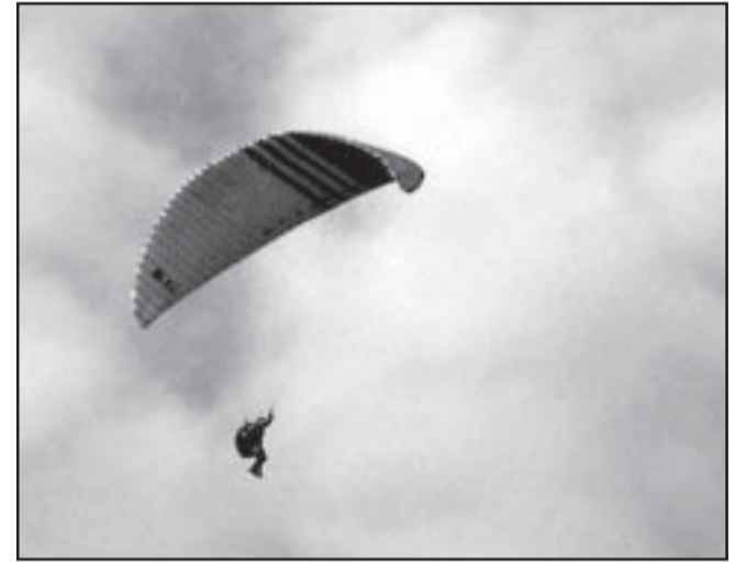
Gyakorló repülés közben

gyobb szellőkés esetében, hogy összecukodik és zuhanni kezd. Ezeket a helyzeteket biztonságosan kezelni, ha megfelelően kiképeztek rá. Én már lettem a pilóta alapvizsgát, de szeretnék tovább lépni. Ehhez persze sok gyakorlás kell, amit legfőképpen az időjárás határol be. A siklóernyővel igen korlátolt időjárási viszonyok között lehet csak repülni, ami azt jelenti, hogy he-tekig is várni kell a megfelelő napra, órára. Eddig 116 alkalommal emelkedtem a levegőbe és 26 órát repültem. A legnagyobb magasság amit elértem az 2.000 méter volt.