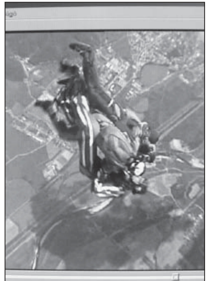
„Csoportos jelenet” az évük eseményeit összefoglaló CD-ről