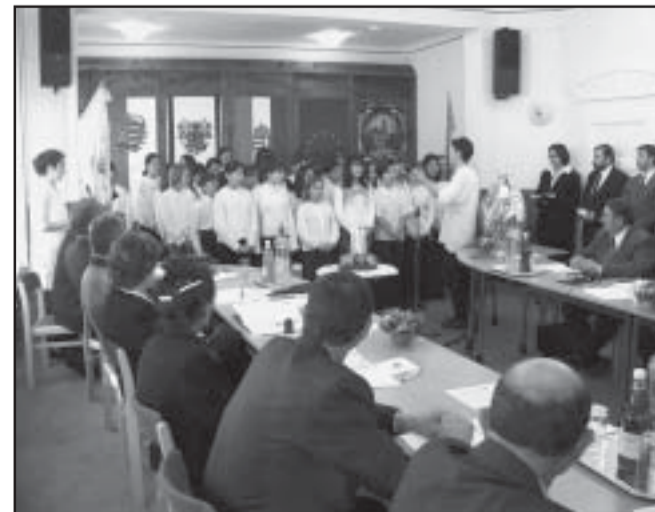
Az 1.Sz. Általános Iskola énekkara karácsonyi dalt énekelt