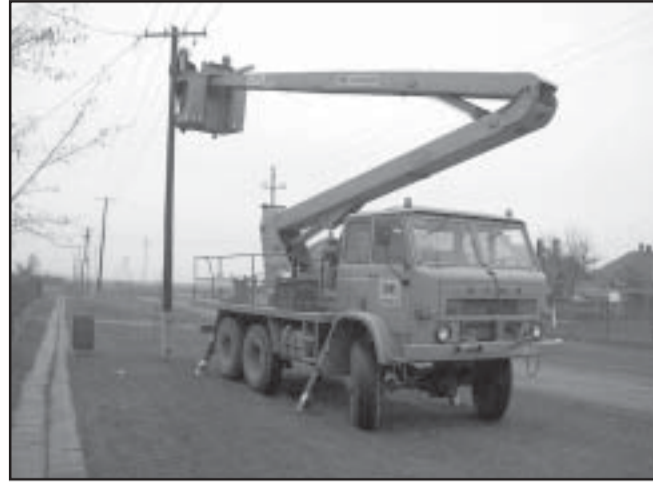
Huszonöt lámpát kellett lecserélni

Köztudott, hogy évek óta gondot okoz Sarkadon a 9-es számú választókerület lakosságának - különösen a Bokor, József A., Hársfa utcákban - , hogy az utcákon elhelyezett közvilágítási modern lámpatesteket rendszeresen tönkre teszik, kiparittyázzák, megrongálják egyes felelőtlen, vandál személyek. Az eredmény vaksötét utcakép. A Sarkadért Választási Közösség egyik fontos ígérete volt az októberi választások alkalmával az, hogy ezen tönkretett világítótesteket a lehető leggyorsabban, még a sötét téli hónapok előtt pótolni fogja. A választásokat követően a DÉMÁSZ és az Önkormányzat példás együttműködésének eredményeként 25 db, több mint félmillió forint értékű lámpatest felszerelésére került sor e hét folyamán.