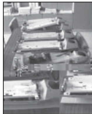
Az egykor fél milliót érő lámpamaradványok

A megbeszélés eredményeként a cigányság jelenlévő képviselői kifejezték azon szándékukat, mely szerint tevékenyen részt kívánunk venni a rongálások megelőzésében. Ennek ér-