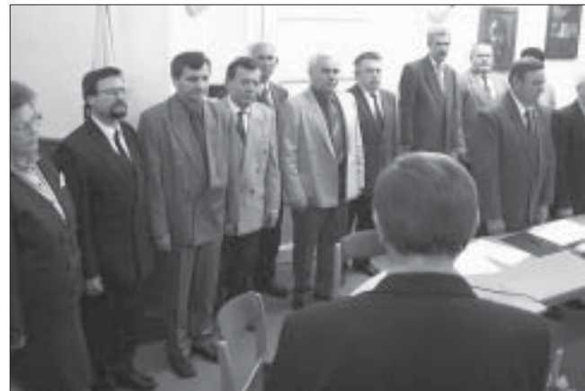
Esküt tesznek a bizottságok külső tagjai