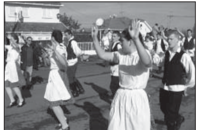
A 2.Sz. Általános Iskola néptáncsoportja is az utcákat járta