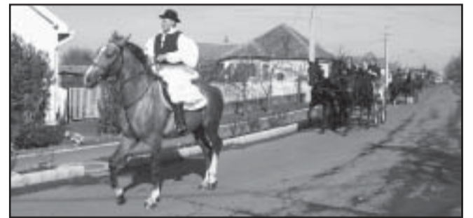
A hintók az Ady Endre utcán

1. forduló eredménye: 1. Szeged PHSE, 2. Szeged Örökifjak, 3. Sarkad Öregek, 4. Gyula, 5. Szarvas, 6. Bcs. Simaügy, 7. Kemény Bcs., 8. Sarkad Ady, 9. Szarvas Orvlövészek.