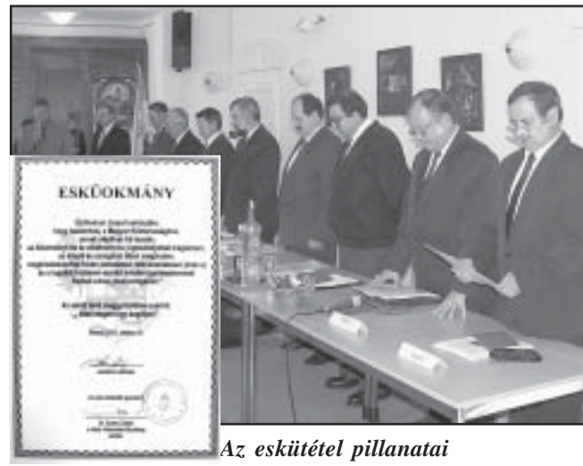
Az eskütétel pillanatai

Kívánom, hogy Európába menetelő további feszesre rántott, szusszanás nélküli napjaitok szellemi álmai és ötletei ölekezéséből fogadjanak újabb, Sarkad lakosságának jobblétét hozó eredményeket. (Folytatás a 2. oldalon)