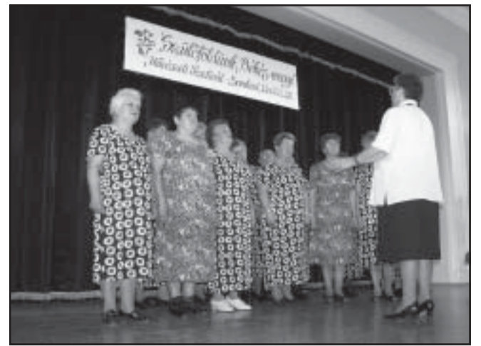
Sarkadi nyugdíjasok énekkara a színpadon

„Szülőföldünk Békés Megye” címmel művészeti fesztiválnak adott otthont a Sarkadi Bartók Béla Művelődési Központ az elmúlt szombaton. Maga a ver-