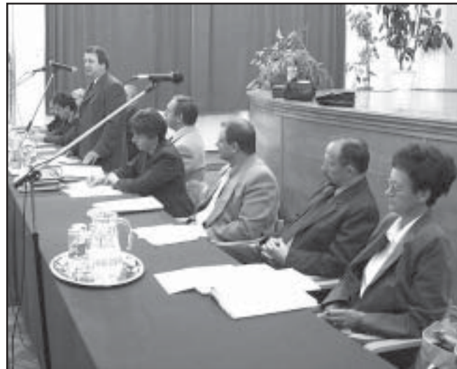
A társulás vezetősége