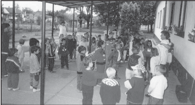
Az ovisok „tornaórja”

Az általános iskolások és az óvodások sportrendezvényeivel folytatódott az események, sajnos az időjárás nem fogadta teljesen kegyeibe ezt napot, mert többször is csepergett az eső és ezért a szabadtéri programok egy része elmaradt. Valamennyi óvodában ez a délelőtt teljes egészé-