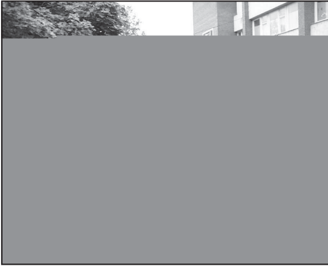
Az általános iskolások futása

A hagyományokhoz híven most is az éjszakai focival kezdődött városunkban a Kihívás Napi program, melyen összesen kilenc csapat vett részt és kergette a labdát kivilágos virradatig. Az élen a következő csapatok végeztek: 1. Halálosztók 2. Butykok 3. Mint a villám ... 4. THC