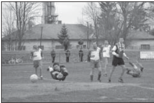
Levegőben „úszó” kapus