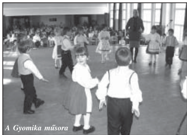
A Gyomika műsora

vészeti Iskola táncos növendékei. A jelmezes felvonuláson 47 jelmezes értékelhetett a zsűri. Rendkívül nehéz volt a feladatuk, hiszen volt itt „angyalarcú” boszorkány, bohóc, katicabogár, fagy, strandfiú, gyümölcsfa és még sorolhat-