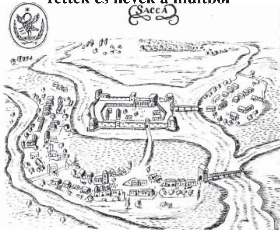
Sarkad egykori várának vázlatos rajza W. Dillich 1600-ban készült ábrája nyomán

Ősök és hősök, arcok és harcok az örök Idő fonálba fűzve – kezdjük így a tallózást Sarkad múltjában. Nagy tisztelettel az elődök és és bizalommal az élők és utódok iránt. Mert e helynek nem egyszerűen története van, hanem történelme. Sarkad ugyanis nem csak tudomásul vette, eltűrt, túlélte a nagybetűvel írt Történelmet, hanem választotta, vállalta és megküzdött, alakította azt, jóval távolabba tekintve a „falu határán”.