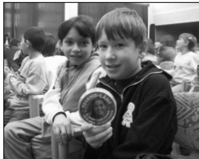
Az ünnepi tombolasorsolás egyik nyertese

A város valamennyi oktatási intézményében feldíszített fenyőfa várta a téli szünet előtti napon a diákokat, óvodásokat. A karácsonyhoz kapcsolódó műsorok után Németországból kapott ajándécsomagot osztottak szét közöttük. Úgy tudjuk a Ferrero csokoládé különlegeségeket senki nem adta vissza azzal, hogy nem szereti.