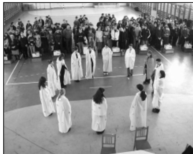
A gimnázium diákjainak Betlehemes játéka