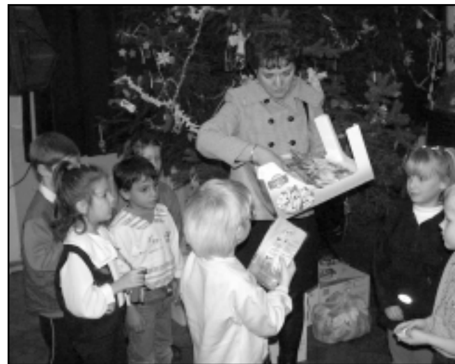
Az 1.Sz. Általános Iskola ünnepsége a művelődési házban volt

A város valamennyi oktatási intézményében feldíszített fenyőfa várta a téli szünet előtti napon a diákokat, óvodásokat. A karácsonyhoz kapcsolódó műsorok után Németországból kapott ajándécsomagot osztottak szét közöttük. Úgy tudjuk a Ferrero csokoládé különlegeségeket senki nem adta vissza azzal, hogy nem szereti.