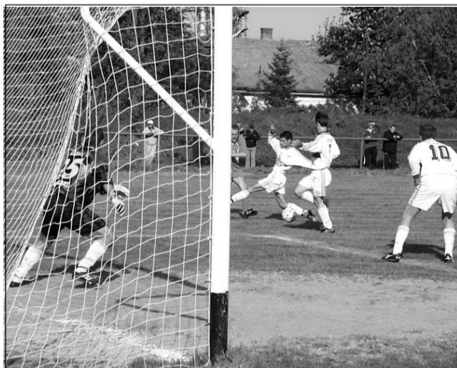
Egy parázs kapujelent hazai pályán az előző mérkőzésen

A félbeszakadt Orosháza - Méhkerék (0 : 0) mérkőzést pont nélkül 0 : 0 -lással eredménnyel igazolták, ezen felül mindkét csapatot három-három büntetőponttal sújtották.