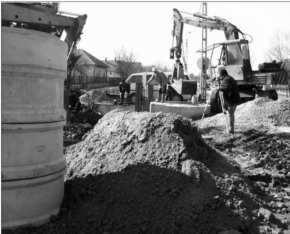
A jelenleg épített csatornarendszer munkálatai az Ady Endre utcában