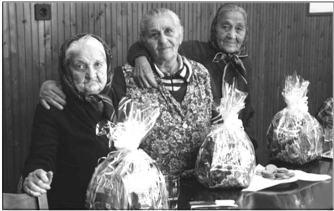
A Sarkadi Cigány Kisebbségi Önkormányzat karácsonykor csomaggal kedveskedett a város három legidősebb roma származású polgárának

Szeretettel várunk minden kedves érdeklődőt 2001. január 22-én (hétfőn) 17.00 órakor a Városi Képtárba (Kossuth u. 7. szám) Kultúra Napi rendezvényünkre, ahol Fazekas László: „Egy fotós szemével” című kiállítása lesz megtekinthető.