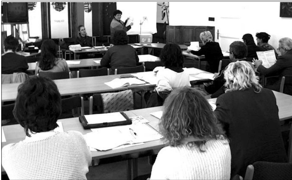
A Városházán január 16-án egész napos felkészítő előadáson vett részt a sarkadi számlálóbiztosok első csoportja.

(Folytatás az 1. oldalról) férőhelyet tervezzenek, hány lakás építése, hány munkahely kialakítása szükséges. Az eredmények alapján összehasonlíthatjuk magunkat más országokkal, megtudhatjuk, hol a helyünk a világban.