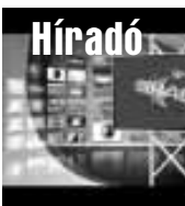
Friss közéleti hírek