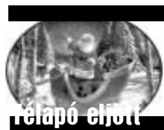
Városi Mikulás ünnepség