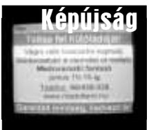
Képiúság 24 órában