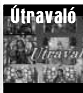
Egyházi gondolatok öt percben