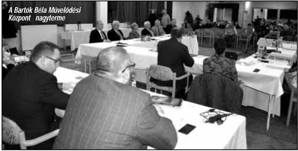
A Bartók Béla Művelődési Központ nagyterme

Az elmúlt héten, csütörtökön tartotta novemberi ülését Sarkad Város Önkormányzatának Képviselő-testülete. A korábbi évek hagyományaihoz hasonlóan a novemberi ülésnek a Bartók Béla Művelődési Központ nagyterme adott helyet, ugyanis a Képviselő-testület ülését közmeghallgatás követte. Az első napirendi pontban dr. Mokán István polgármester számolt be a lejárt határidejű határozatok végrehajtásáról, továbbá tájékoztatást adott az októberi ülés óta eltelt időszak fontosabb eseményeiről. A második napirendi pontban önkormányzati rende-