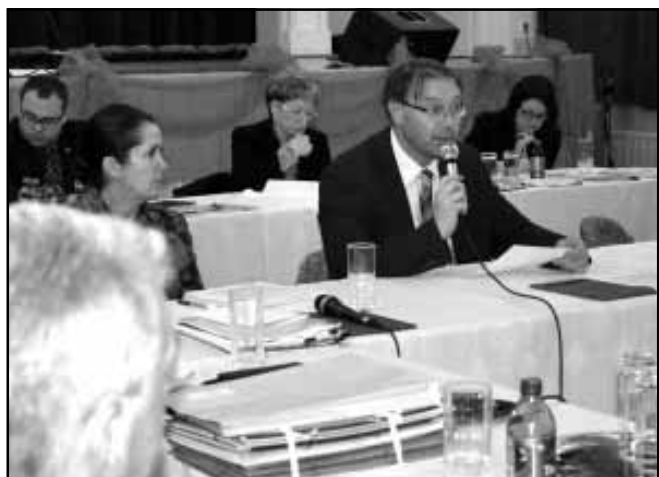
Dr. Mokán István polgármester beszámolója

légbajnoki ezüstérmes bokszoló támogatásáról. (Szellő Imre profi ökölvívó soron következő mérkőzését 2014. december 6-án, 21.45 órától az M1 közvetíti!) A bejelentések napirendi pont keretében véleményt alkotott a Képviselő-testület a Békés Megyei Pedagógiai Szakszolgálat Szervezeti és Működési Szabályzatáról, döntött a Sarkadi Roma Nemzetiségi Önkormányzat támogatási kérelméről, mely keretében 50 ezer Ft támogatást biztosított a roma nemzetiségi önkormányzat számára. Szintén a bejelentések napirend keretében született