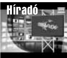
Friss közéleti hírek (ism)