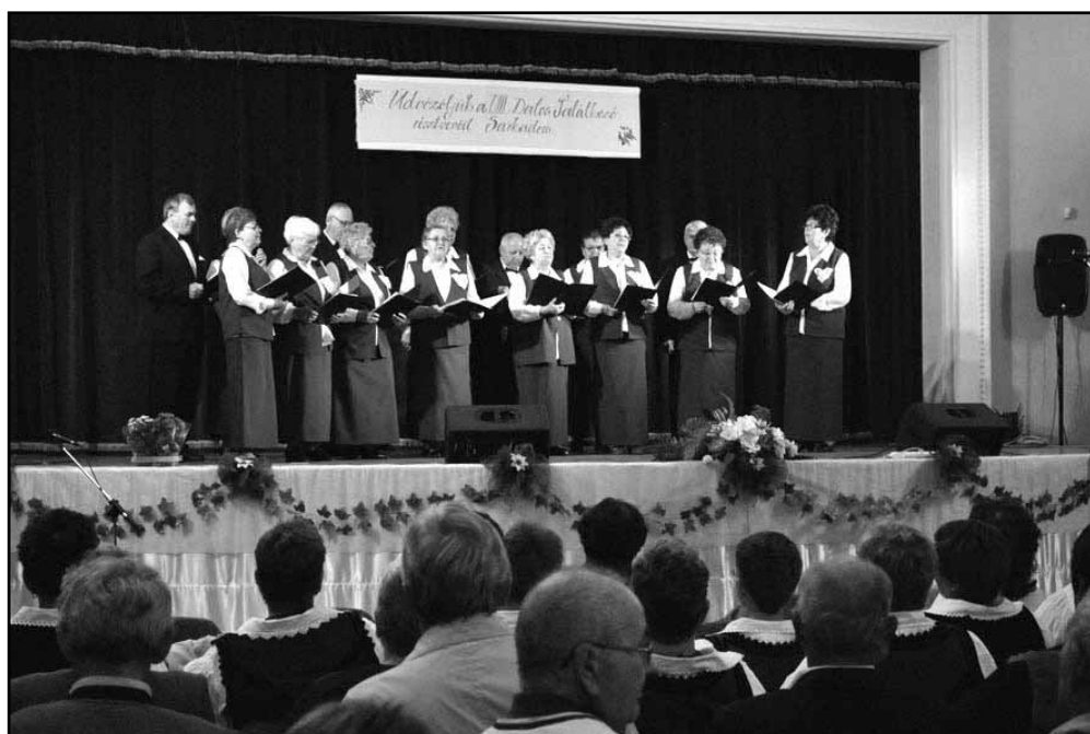
Színpadon a Romániai Magyar Nyugdijasok Szövetségének nagyszalontai vegyeskara