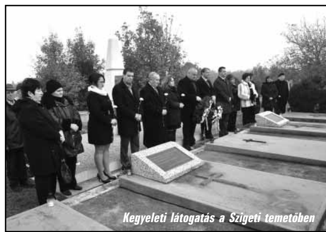
Kegyeleti látogatás a Szigeti temetőben