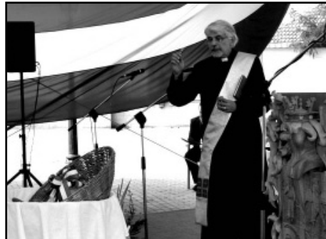
Az új kenyér megszentelése és megszegése után az ünnepség résztvevői egy-egy cipőt, az új kenyér kicsinyített mását kapták ajándékba