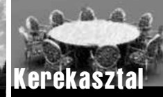
Kerekasztal beszélgetés (ism)