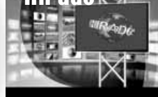
Friss közéleti hírek