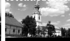
Belvárosi Református Templom