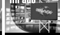
Friss közéleti hírek (ism)