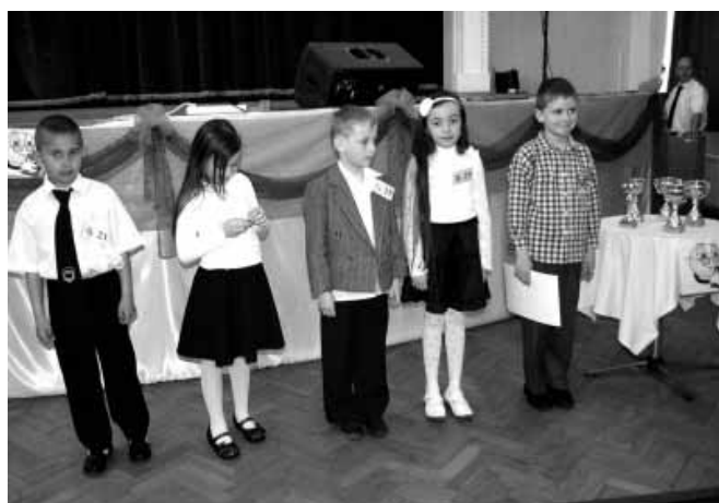
Az első korcsoport döntőbe jutott versenyzői

A Bartók Béla Művelődési Központ és Könyvtár az idei évben is meghirdette az „Év hangja a sarkadi kistérségben” című szavalóversenyét. A nemes versengésre összesen 122 nevezés érkezett. Az általános iskolás korosztálytól kezdve egészen a nyugdíjasokig, minden verszerető aktivizálta magát. A nevezések legtöbbször Sarkadról érkeztek, de neveztek Sarkadkeresztúrról, Kőtegyánból és Biharugráról is. A szavalók 2 napon mértek össze tudásukat, 6 korcsoportban. A döntőre 2014. április 10-én 9 órakor kerül sor, amikor kiderül, hogy ki