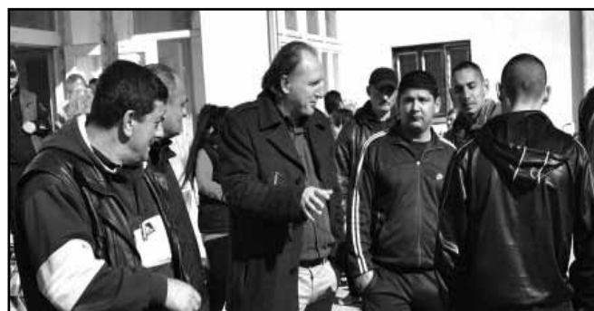
Sarkad polgármestere a Startmunka Mintaprogram városi telephelyének udvarán