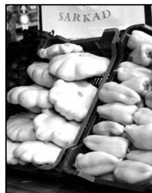
Sarkadi zöldségfélék a közfoglalkoztatási expón

A fenn leírt fejlesztéseknek köszönhetően létrejön egy komplex mezőgazdasági-közfoglalkoztatási telephely, mely kiváló alapot teremt a következő esztendőben is a