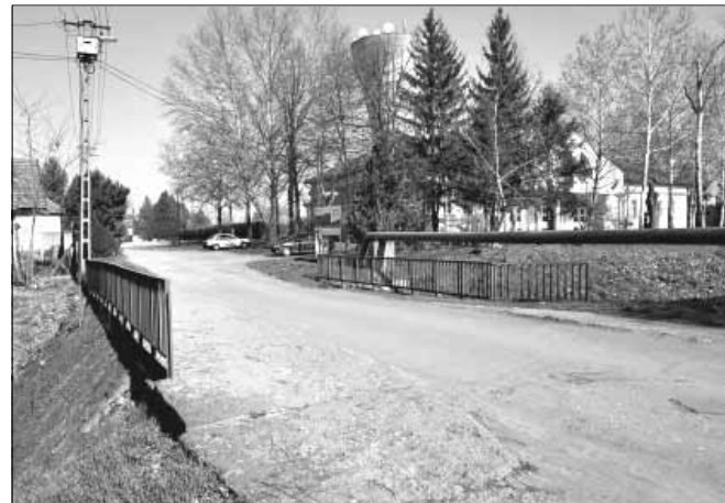
A Vár utcai „kishidat” elbontják és újat építenek helyette