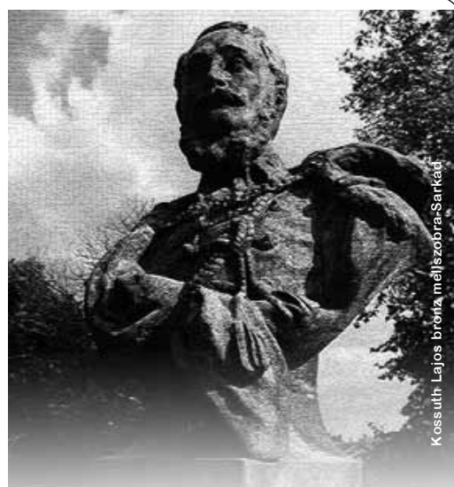
Kossuth Lajos bronz mellszobra-Sarkad