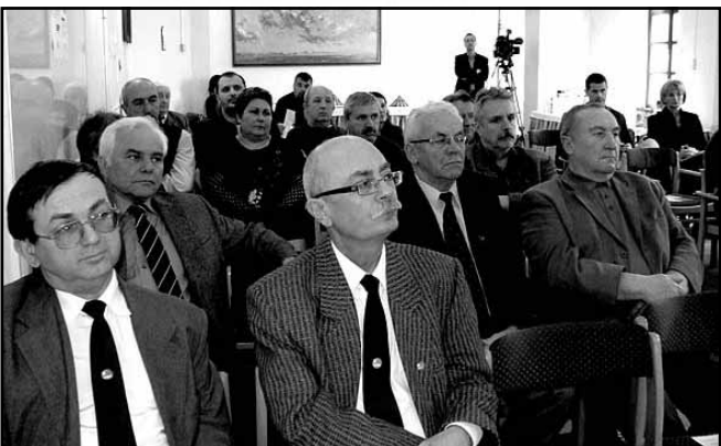
A program résztvevőinek egy csoportja