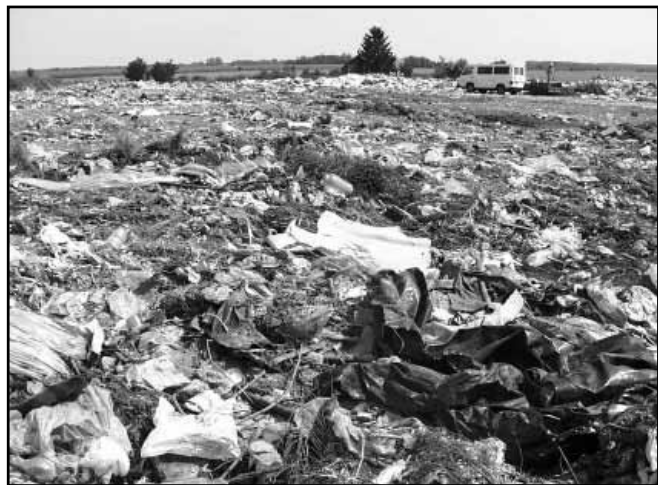
A sarkadi kommunális-hulladék lerakó közvetlenül a bezárása előtt

Pályázati közbeszerzések: A projektben eddig kiválasztott szereplők: a közbeszerzési szakértő (MÁTRIX Audit Kft.), a jogi szakértő (Dr. Uzonyi Ügyvédi Iroda) és a kommunikációs feladatokat ellátó cég (Orosházi Média Kft.), a mérnökszervezet (DAREH I. Mérnök Konzorcium (konzorciumvezető: Országos Vízügyi Beruházási Mérnöki Konzulens és Tervező Kft., konzorciumi tagok: UTIBER Közúti Beruházó Kft., JT Infotéka Szolgáltató Kft.)), kivitelező (DAREH-I. Konzorcium, vezető konzorciumi tag: KÖZGÉP Építő- és Fémszerkezet-gyártó Zrt., tagok: Bácska Mérnöki Szolgáltató Kft., WEST HUNGARIA BAU Kft., WESTBERG Építőipari és Kereskedelmi Kft.).