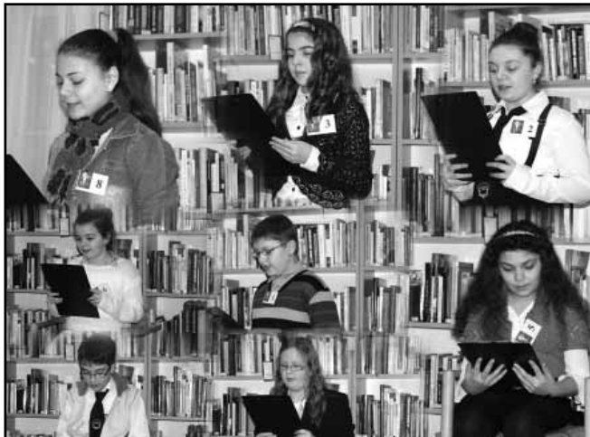
Az 5-6 osztályos versenyzők