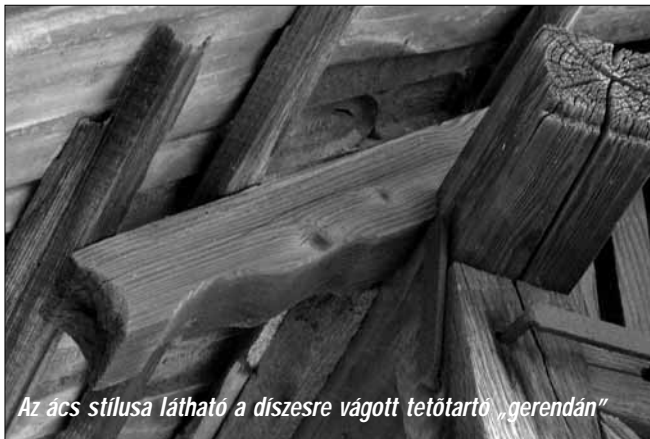
Az ác s stílusa látható a díszre vágott tetőtartó „gerendán”