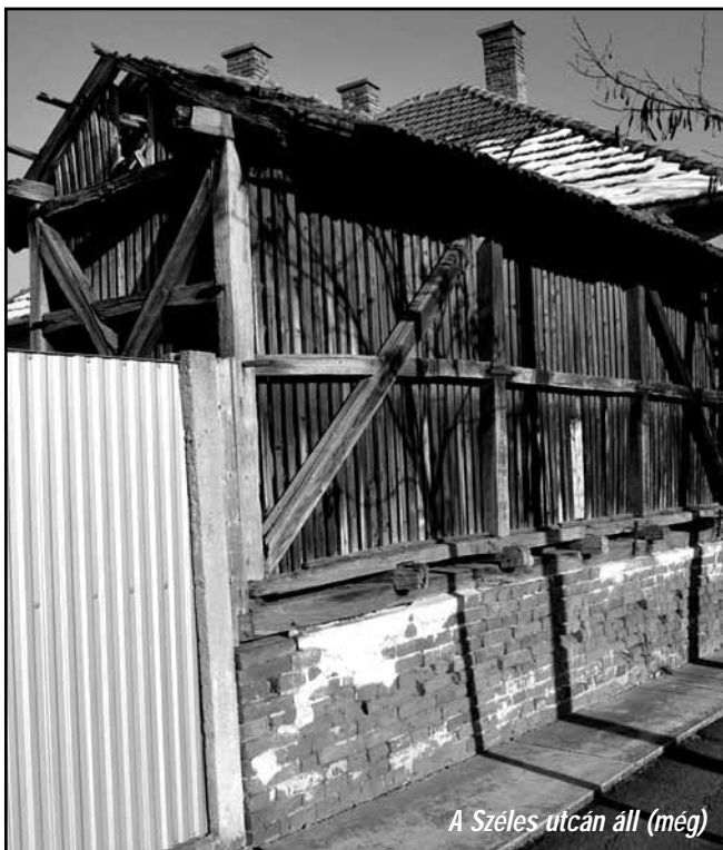
A Szeles utcán áll (még)

A göré Kárpát-medencében a kukorica elterjedésével egy időben vált igazán ismertté, bár néhány forrás már korábban is említi. A göré-típusú építmények a mediterrán térségben már az ókor folyamán megjelentek. Magyarországon igazán a 18. században kezdett terjedni. Használata a 20. század ele-