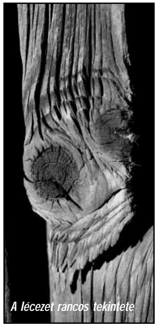
A lécezet rancos tekintete

Jén a szegényparasztság kivételével minden agrárgazdálkodó rétegben elterjedt volt. A göré mint státusz szimbólum is szerepet játszott. Az építmény méreteiből következtetni lehetett a gazda vagyoni helyzetére. A módos gazdaházak udvarán az utcával határos oldalon kerítés gyanánt görét építettek. Minél magasabb és minél hosszabb volt annál jobban hirdette a gazdagságot. Az arra vetődött vándor előtt is nyilvánvaló volt, hogy nem szegény paraszt