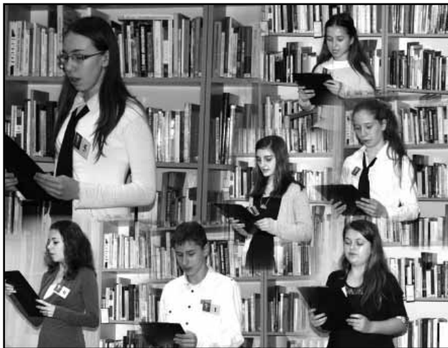
A 7-8 osztályos versenyzők