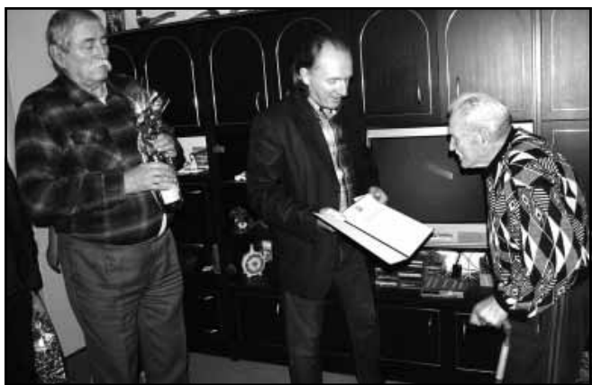
Jobbról az ünnepelt, Bende Róbert polgármester (középen) az Orbán Viktor miniszterelnök által aláírt emléklappal és dr. Szabó László tanácsnok

A 255/2008. (X. 21.) kormányrendelet értelmében Magyarország Kormánya – az Idősügyi Tanács kezdeményezésére – 2009. évtől vezette be a 90., a 95. és a