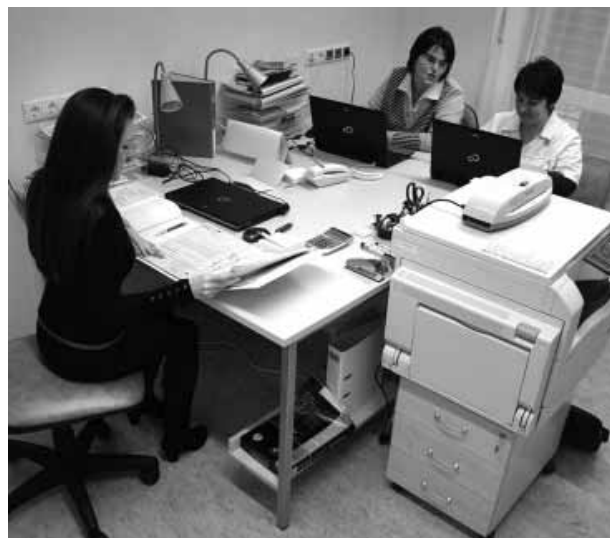
Munka az Egészségfejlesztési Irodában

Az Irodát intézményünk II. emeletén találhatják, ahol fogadni tudjuk ügyfeleinket, valamint itt történik a regisztrációs, adminisztrációs feladatok elvégzése, programok szervezése, dokumentálása.