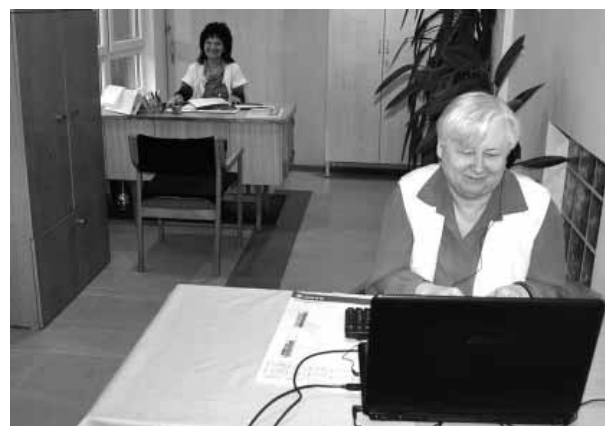
Mentálhigiénikus és Dietetikus irodájában

Nemzeti Fejlesztési Ügynökség www.ujszechenyiterv.gov.hu 06 40 638 638