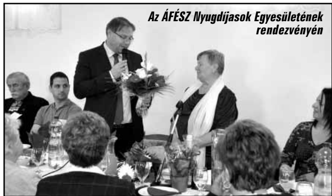
Az ÁFÉSZ Nyugdíjasok Egyesületének rendezvényén

napja alkalmából tartottak ünnepséget a Kistérségi Humán Szolgáltató Központ által működtetett Gyulai úti idősök otthonában, ahol az Eperkert utcai óvodások, illetve a „Leg A Láb” Alapfokú Művészeti Iskola néptáncosai színes műsorral kedveskedtek az otthon lakóinak, valamint a jeles nap alkalmából városunk polgármestere köszöntötte az intézmény ezüsthajú, arany szívű lakóit. -mk