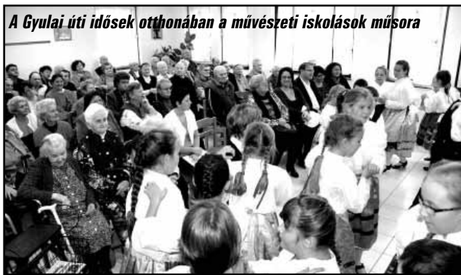
A Gyulai úti idősök otthonában a művészeti iskolások műsora