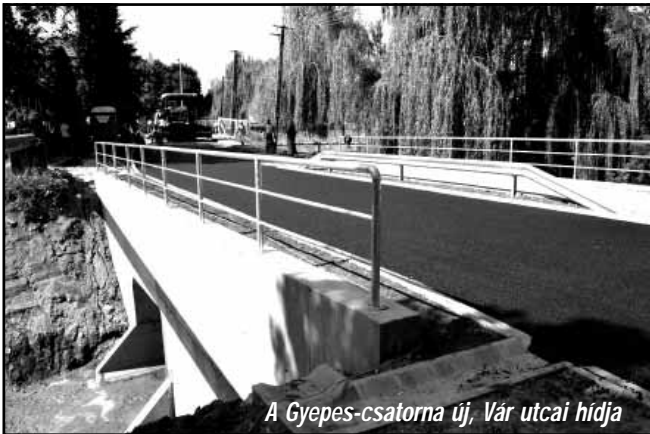
A Gyepes-csatorna új, Vár utcai hídja