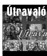
Vallásos gondolatok 10 percben