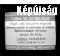
Képtűság 24 órában