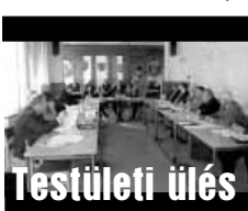
Képviselők szeptemberi tanácskozása