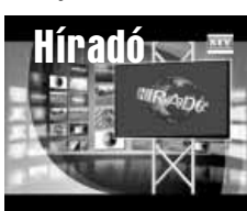
Friss közéleti hírek