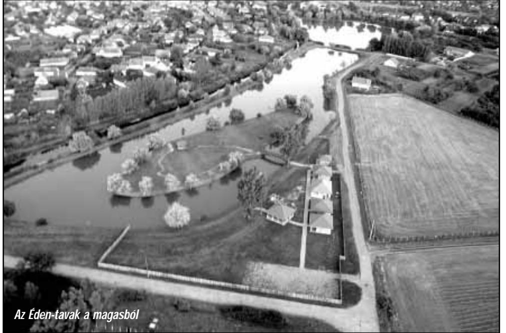
Az Éden-tavak a magasból

A horgász egyesület három éve működteti az Éden-tavakat és folyamatosan áll elő a tavak környezetét fejlesztő, újító ötletekkel. Dr. Mokán István polgármester elmondta, idén márciusban újra megkereste az önkormányzatot az egyesület és ez a megkeresés fordult ismét gyümölcsöző együttműködésbe. Ennek köszönhetően 2015-ben is jelentős fejlesztések valósultak meg a tavak környékén, tovább növelve a tavakra kijáró horgászok és a helyi lakosság komfortérzetét.