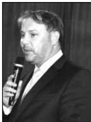
Dr. Mokán István polgármester